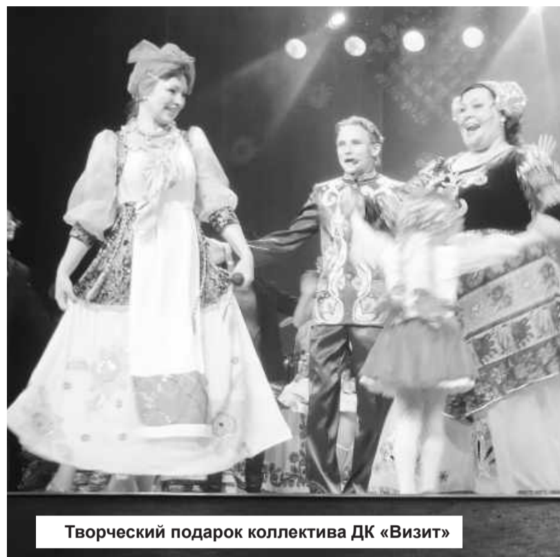
Творческий подарок коллектива ДК «Визит»

Труд медицинских работников окружен страданиями и болью. Что и говорить, позитива мало. Они достойны, как никто другой, в этот праздничный вечер насладиться радужным фейерверком, сотканным из эмоций, талантливых идей и зажигательных мелодий. С огромным желанием всем присутствующим его дарит творческий коллектив Дворца культуры «Визит».