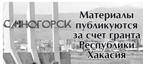
Материалы публикуются за счет гранта Республики Хакасия