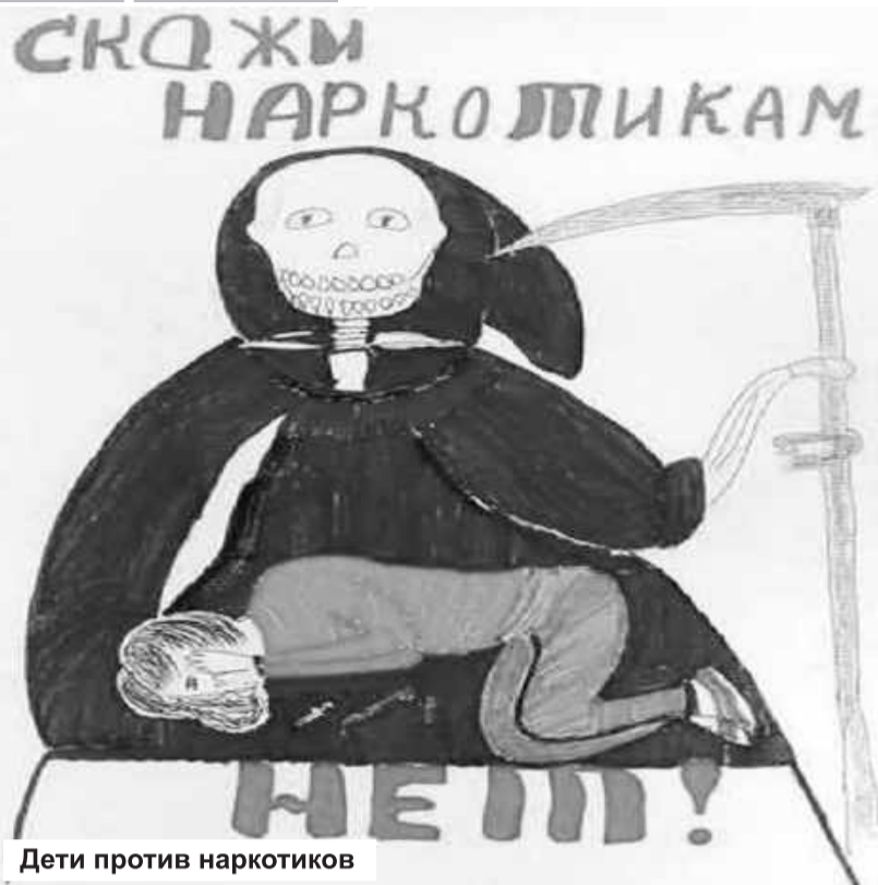
Дети против наркотиков

Древние греки называли человека, страдающего влечением к оцепенению, наркоманом. В России каждый год от опасного зелья погибает около 20 тысяч подростков. Начиная с нового столетия употребление одурманивающих веществ ежегодно увеличивается на 60 процентов. Сибирский федеральный округ, в состав которого входит уникальная своей историей и красотой природы Республика Хакасия, занимает первое место по наркомании в РФ. Мы можем преодолеть все трудности, восстав духовно. Это единственный спасительный путь, ведущий к оздоровлению. Святой праведный Иоанн Кронштадтский воскликнул: «Восстань же, русский человек! Перестань безумствовать! Довольно! Довольно пить горькую, полную яда чашу – и вам, и России!».