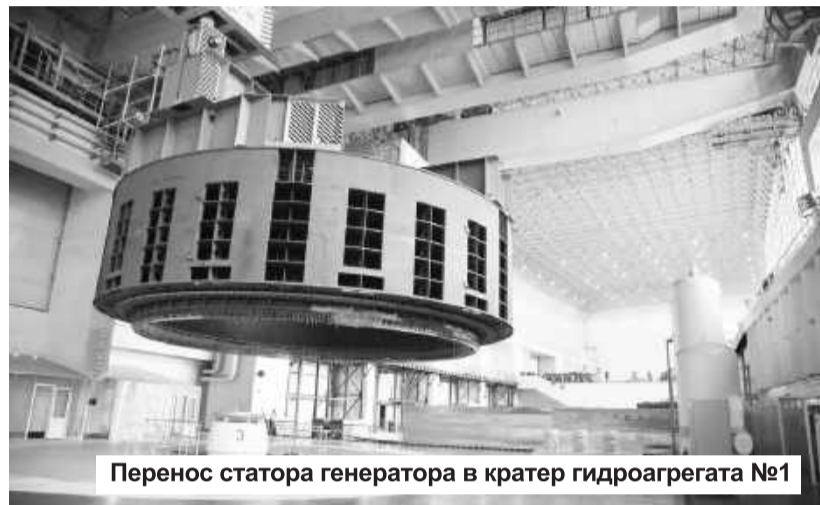
Перенос статора генератора в кратер гидроагрегата №1

Срок службы новых гидроагрегатов возрастет до 40 лет, при этом максимальный КПД гидротурбины составит 96,6 процента. Улучшатся и ее энергетические и кавита-