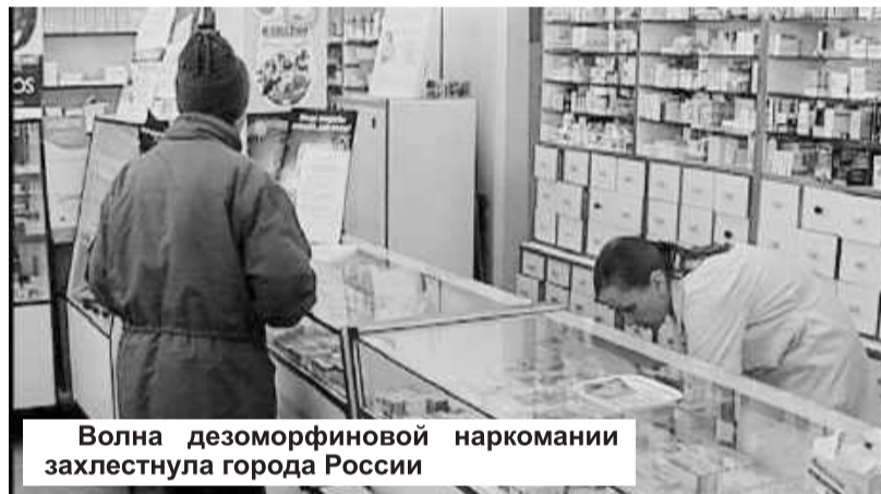
Волна дезоморфиновой наркомании захлестнула города России

способствует быстрому привыканию, формируя сильную зависимость. Патологии вызывают вещества, которые попадают внутрь организма: бензин, чистящие средства. Следствием их воздействия становятся тромбозы вен верхних и особенно нижних конечностей, трофические язвы, множество гнойных осложнений, отсутствие иммунитета. Дезоморфиновых наркоманов ждет слепота, гангрена конечностей, разрушение печени, почек, сердца. Этот наркотик употребляют путем внутривенных инъекций, отсюда риск заболевания вирусными и токсическими гепатитами, ВИЧ-инфекцией. Шанс спасти минимален.