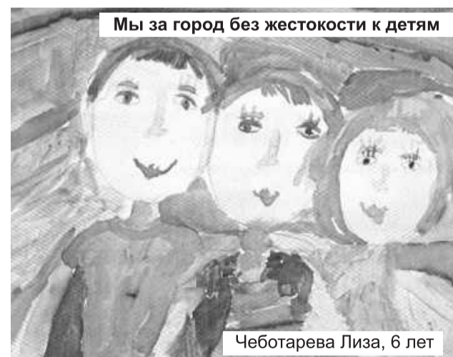
Мы за город без жестокости к детям

Зло торжествует тогда, когда с ним не пытаются бороться. Надо помнить, что кроме кнута есть масса способов влияния на ребенка. Надо считаться с его мнением и всегда стараться понять, принять, рассмотреть любые трудные ситуации адекватно, без ненужных эмоций и рукоприкладства.