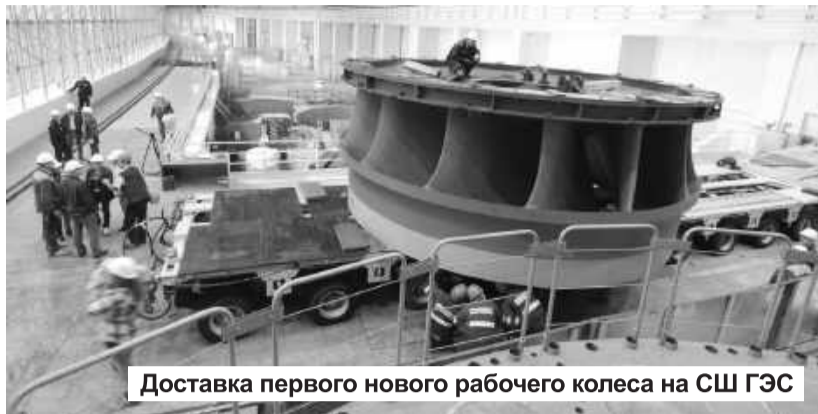
Доставка первого нового рабочего колеса на СШ ГЭС

Напомним, что сборка статора проходила в кратере гидроагрегата №9, после чего он был перенесен в предназначенный для него