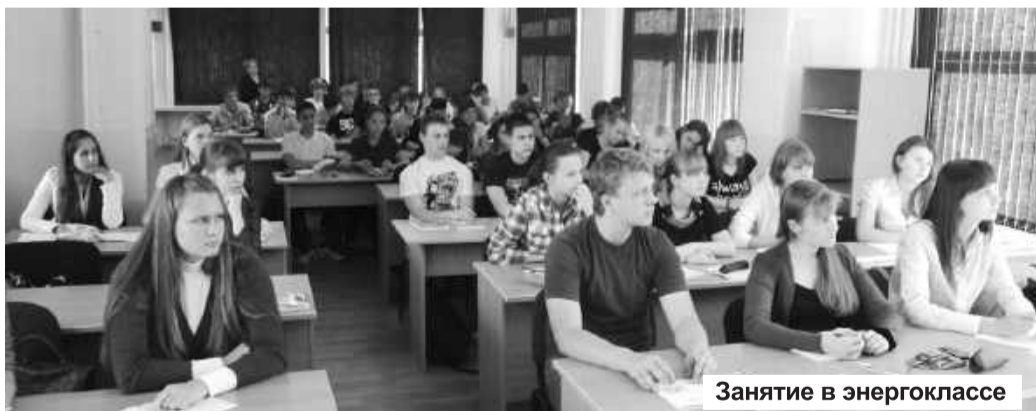
Занятие в энергоклассе

Предварительно перед зачислением в энергокласс проводилась диагностика инженерных способностей подростков, разработанная на базе методик психологического центра Саяно-Шушенского учебного центра Корпоративного университета гидроэнергетики (КорУНГа) ОАО