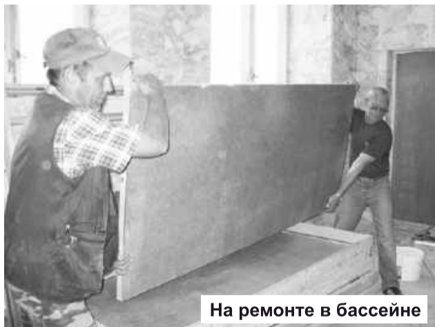
На ремонте в бассейне

ли весомый вклад в общее семейное дело. А сейчас организовали свою фирму «Сибирские окна».