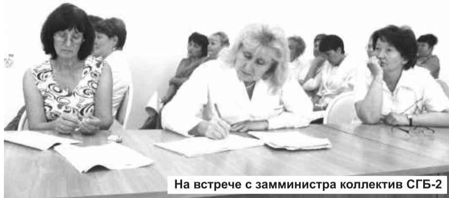
На встрече с замминистра коллектив СГБ-2

миллиона рублей. Средства уже поступают через ФОМС.