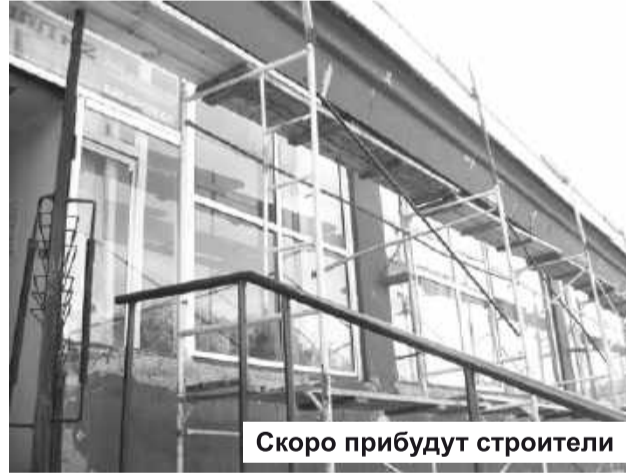
Скоро придут строители

возможности. Сейчас там впервые идет капитальный ремонт.