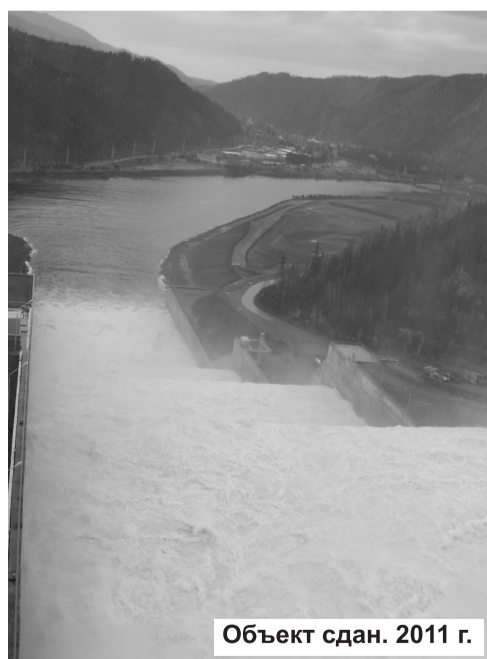
Объект сдан. 2011 г.

непрерывный контроль состояния берегового водосброса, параметров пропуска расходов через оба туннеля, а также про-