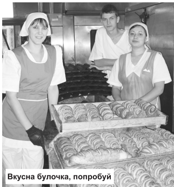
Вкусна булочка, попробуй