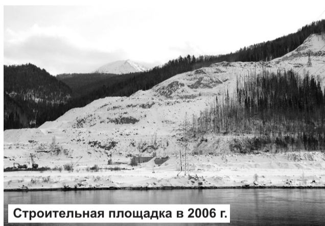
Строительная площадка в 2006 г.