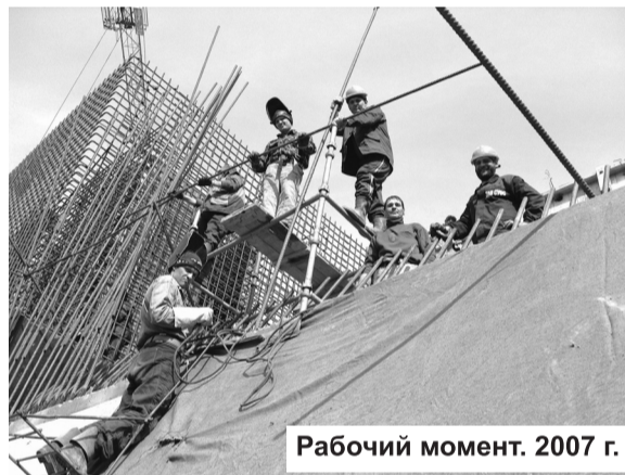
Рабочий момент. 2007 г.