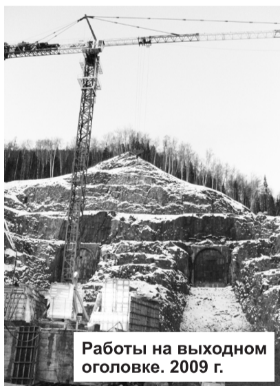
Работы на выходном оголовке. 2009 г.