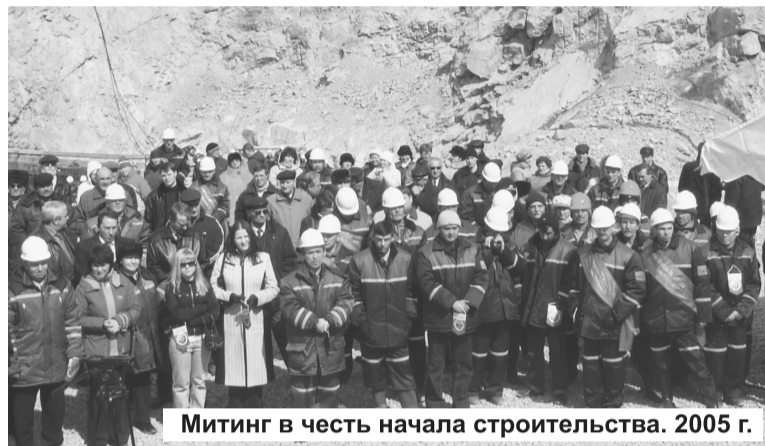
Митинг в честь начала строительства. 2005 г.