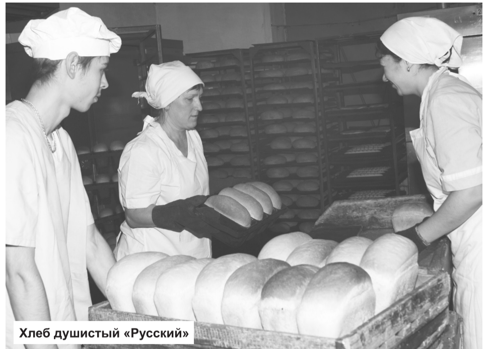
Хлеб душистый «Русский»