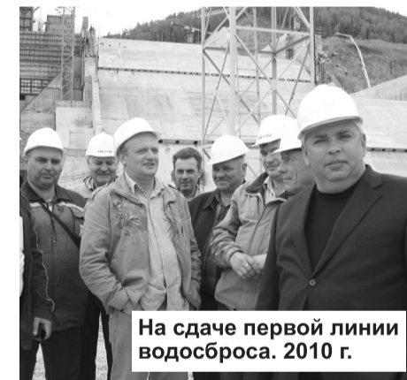
На сдаче первой линии водосброса. 2010 г.

Это доказано временем. Все сооружения, возведенные саянскими гидростроителями, надежно врастают в землю и становятся с ней единым целым.