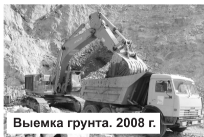
Выемка грунта. 2008 г.