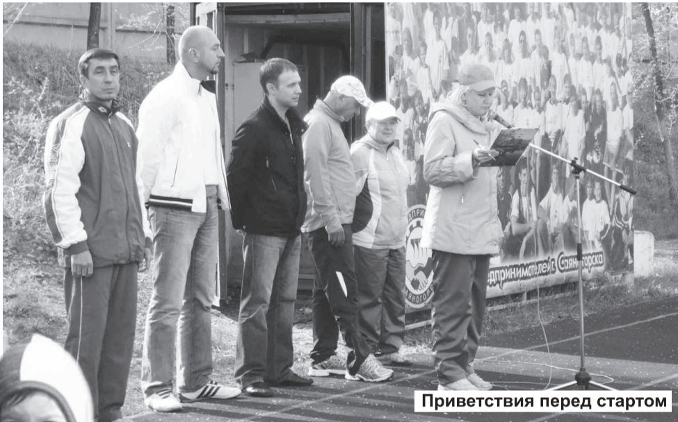
Приветствия перед стартом