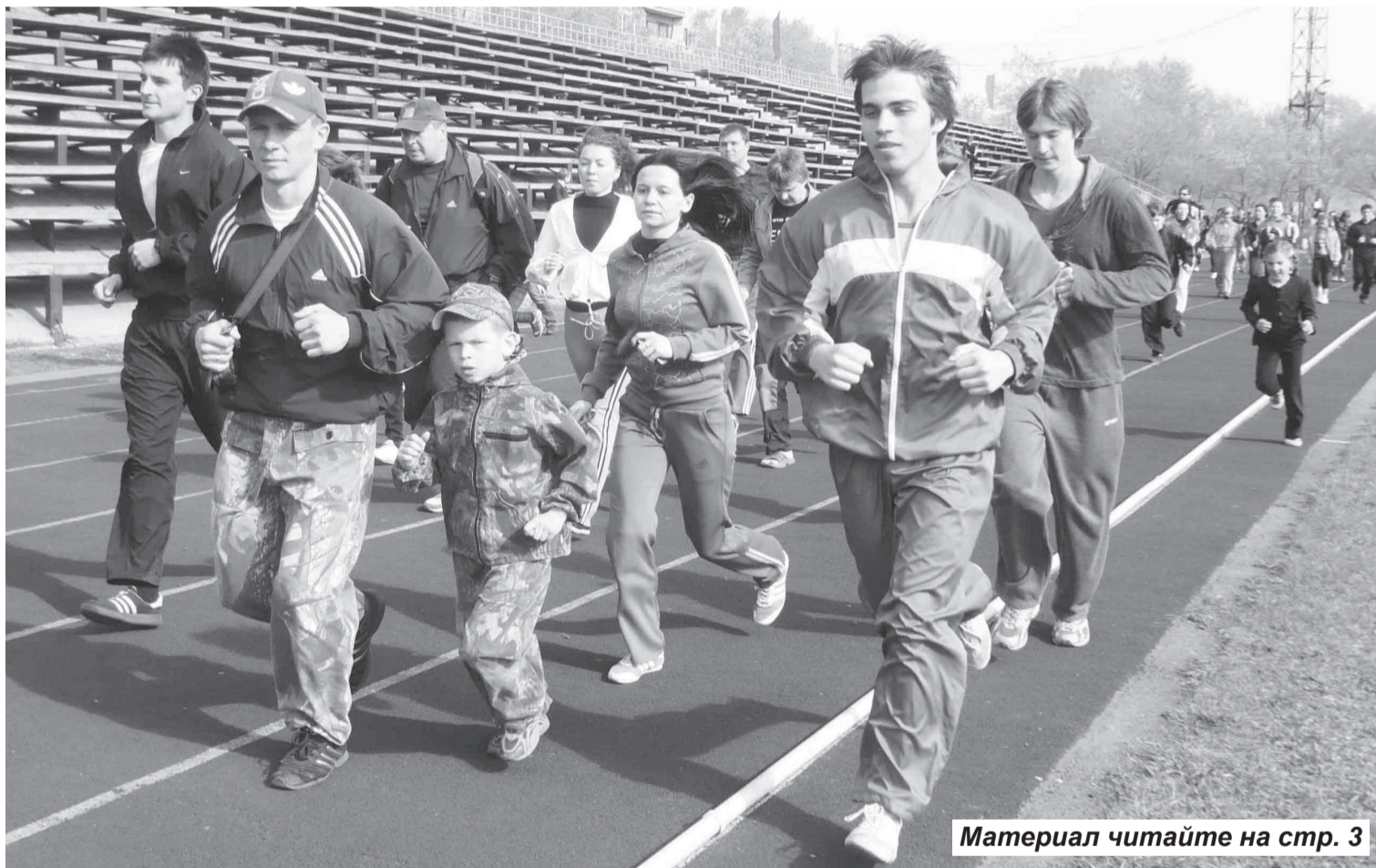
Материал читайте на стр. 3

Шестой раз в нашем городе стартовал Пробег выходного дня «Саяногорск – за здоровый образ жизни!»