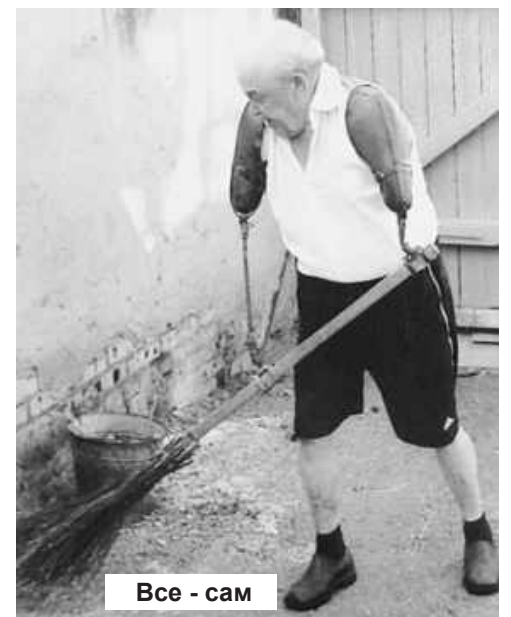
Все - сам