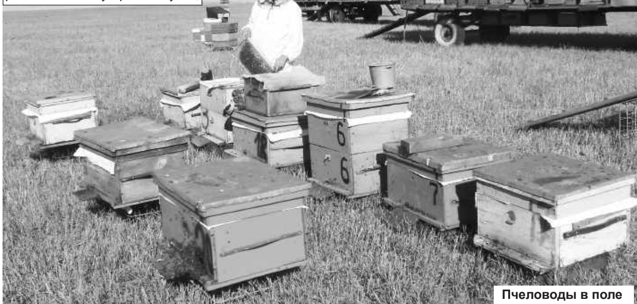
Пчеловоды в поле

- Пчелы – умные существа, организованные. Иногда поражаешься и задаешься вопро-