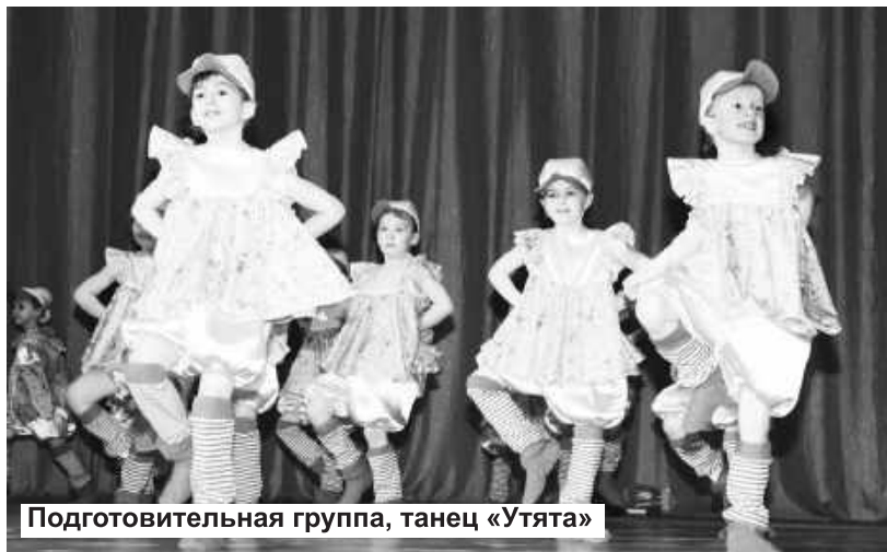
Подготовительная группа, танец «Утята»

Распахнув двери Дворца культуры, попадаю в мир фантазии, творчества и огромного позитива. Сегодня здесь с особой силой бурлит талант, заряжая пространство эмоциями и прекрасным настроением