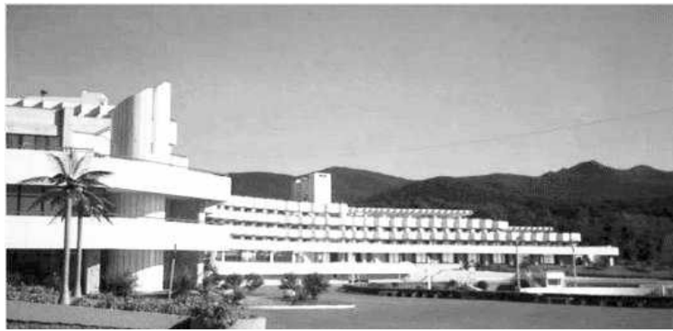
Всероссийский детский центр «Океан» (г.Владивосток)

ми республики. В программе летней школы предусмотрены учебные занятия, которые проведут специалисты и члены Избирательной комиссии Республики Хакасия, преподаватели базовых школ республиканского Избиркома и территориальной комиссии г. Абакана. Школьники ожидают деловые игры, конкурсы, тренинги, экскурсии, встречи с известными в рес-