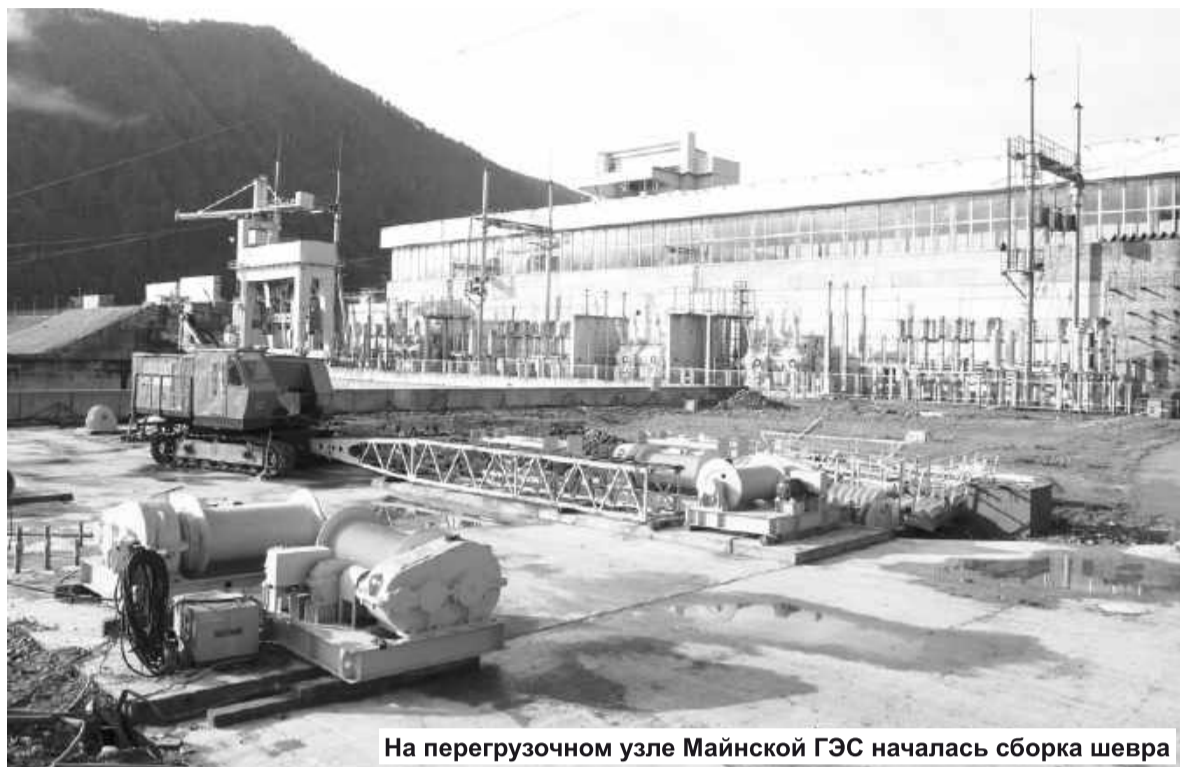
На перегрузочном узле Майнской ГЭС началась сборка шевра

Понеслось... Едва оправившись от августовских ран 2009-го, Саяно-Шушенская ГЭС начала новый отсчет своей истории, медленно, но верно возвращая себе былую славу. И уже ни у кого не возникает сомнений: пройдет совсем немного времени и «жемчужина Саян» предстанет перед нами во всем великолепии обновленной мощи.