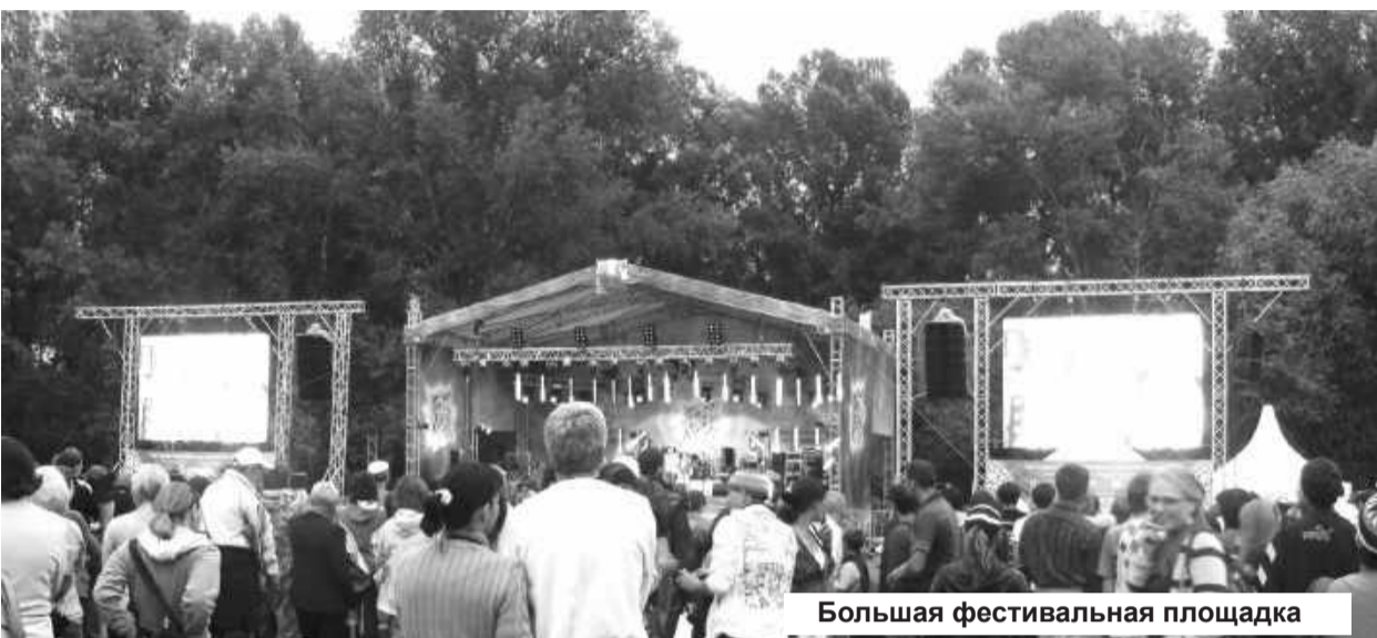
Большая фестивальная площадка

Все, кто погрузился в светлый мир фестиваля, знают, что «Саянское кольцо» – это не только музыка и танцы. Пространство фестиваля дает людям возможность самостоятельно прикоснуться к таинственному, но такому близкому миру традиционной культуры во всем его многообразии. Знакомство с ремеслами, участие в обрядах и других этнических действиях, просмотры этнофильмов, обучение национальным танцам и игре на музыкальных инструментах, народные театральные представления – это далеко не все, что подготовило «Саянское кольцо»