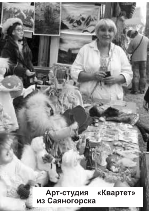
Арт-студия «Квартет» из Саяногорска

зрителям. Еще одной доброй традицией фестиваля стали мастер-классы по народным оздоровительным практикам, юрты сказителей, этнотеки.