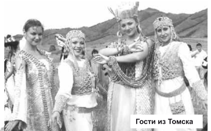
Гости из Томска