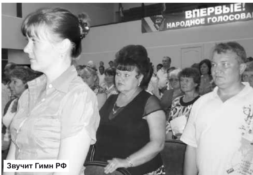
Звучит Гимн РФ

организаций общества со свежими идеями, активно принимающих участие в разработке Народной программы и Народного бюджета. Встречи с гражданами республики показали, что проблемы федерального уровня составляют все-го десять процентов, а местные вопросы занимают 90 процентов. Анализируя сказанное, нужно понимать, что предложения от рес-