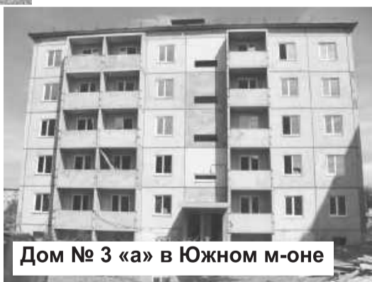
Дом № 3 «а» в Южном м-оне

Накануне Дня строителя Российский Союз строителей обновил рейтинг 150-ти лучших строительных организаций, предприятий строительных материалов и стройиндустрии по итогам XV Всероссийского конкурса за 2010 год. Фирма «Саянстрой» - в числе лидеров строительного комплекса России!