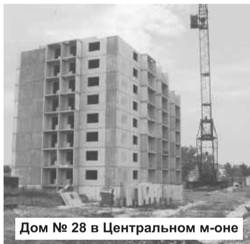
Дом № 28 в Центральном м-оне

ми кругами обозначились под глазами молодого специалиста, но когда заходит разговор о людях, лицо его светлеет: