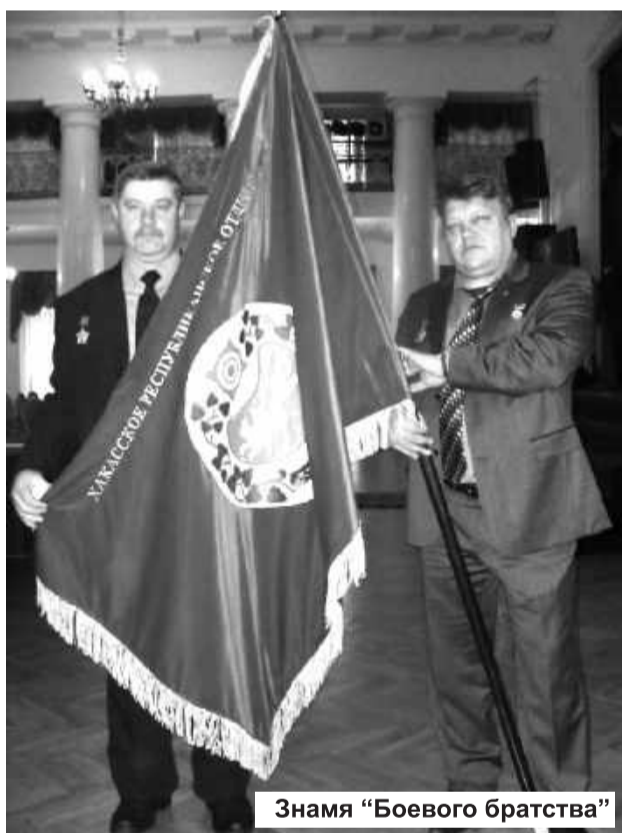
Знамя «Боевого братства»