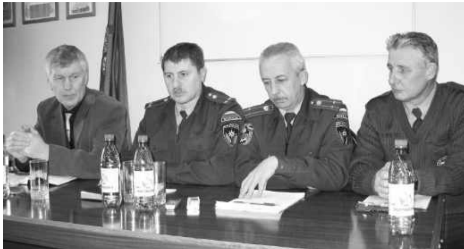
Подразделения Саяногорского гарнизона пожарной охраны готовы к выполнению задач по предназначению

Только самоотверженные, добрые и сильные духом люди способны выполнять благородную миссию защиты населения от огненной стихии и предотвращения чрезвычайных ситуаций. Каждая спасенная жизнь, ликвидированный очаг возгорания и сохраненное имущество - заслуга огнеборцев, их гражданский подвиг. В 2010 году пожарными спасено