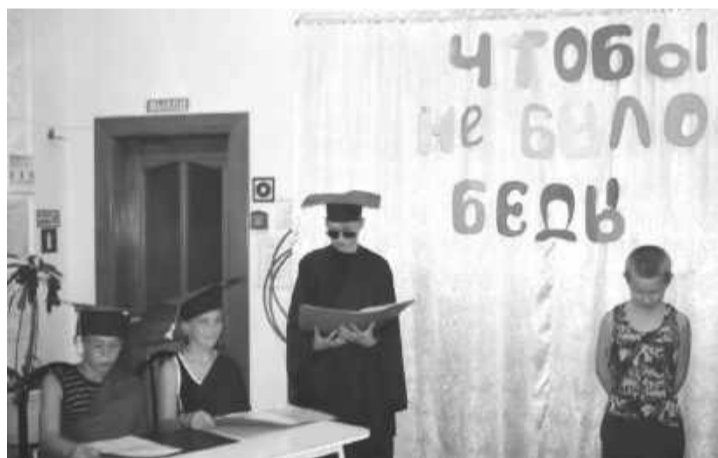
За четыре летних сезона Майнский центр социальной помощи посетили 270 ребятишек.

Дети очень разные: бойкие и спокойные, ершистые и покладистые, замкнутые и инициативные. Им все очень интересно, хотя многое знать, в том числе и о вредных привычках. Тема «Дети и наркотики» всегда остается одной из самых сложных, так как преподнесение данного материала детям вызывает много вопросов и противоречий. Наша задача - рассказать доступно, не навредить, а главное - поселить в душе ребенка звоночек опасности, который сработает и остановит в нужный момент.