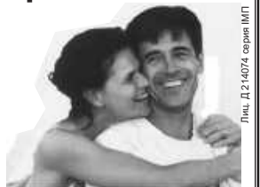
Лин. Д.214074 серия ИП

Продам готовый бизнес в Красноярске. Единственный учредитель. Разные виды деятельности, в том числе оптовая и розничная торговля (в составе оптово-розничного склад-магазина на «Енисейском» рынке). 3 500 000 руб. Т. 8-902-923-04-84