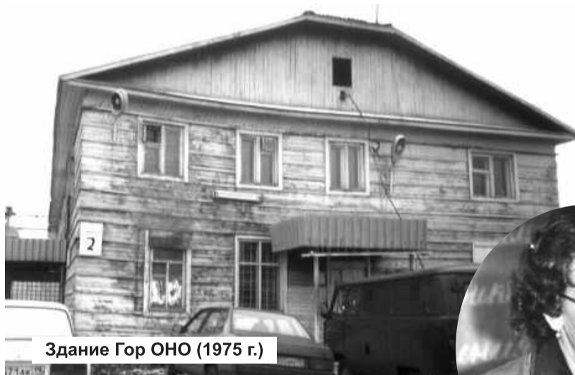
Здание Гор ОНО (1975 г.)

Под их началом работали десять образовательных учреждений, ранее входивших в состав Бейского РайОНО. Строительство промышленных гигантов – СШ ГЭС и Саянского алюминиевого завода обеспечило развитие всех городских инфраструктур, приток населения и масштабное жилищное строительство. Такой размах потребовал возведения новых школ и детских садов. В 1982 году, после сдачи в эксплуа-