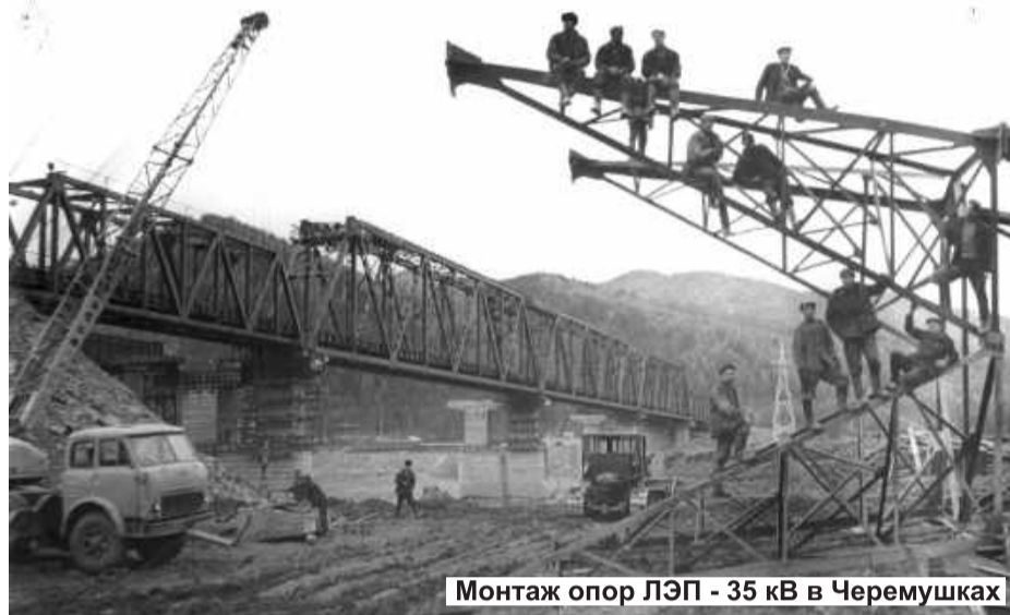
Монтаж опор ЛЭП - 35 кВ в Черемушках

Основой коллектива стали 18 специалистов, командированных трестом «ГЭМ». К началу монтажа основного оборудования в 1967 году численность квалифицированных рабочих достигла более 400 человек. Это ста-