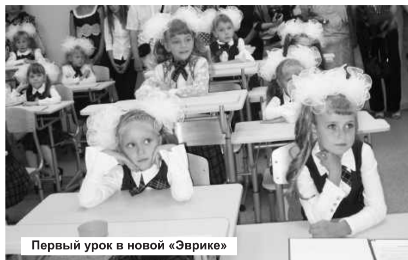
Первый урок в новой «Эврике»

В этом году, на основании соглашения Министерства Российской Федерации по делам гражданской обороны, чрезвычайным ситуациям и ликвидации стихийных бедствий и Правительством Республики Хакасия