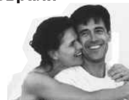
Лиц. Д 2 1074 серия ИМГ

ЗВОНИТЕ И ЗАПИСЫВАЙТЕСЬ: Тел.: 7-67-01, 8-913-050-2838