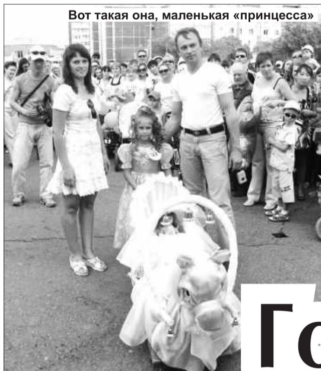
Вот такая она, маленькая «принцесса»

- Загс ждал парада колясок целый год. В 2009-ом была первая проба, и число участников невиданного доселе мероприятия не превысило 30 человек. В этом году отродно видеть - растет и рождаемость, и количество детских колясок. Невольно вспоминаются исторические времена 25-летней, 30-летней давности, когда рождаемость в Саяногор-