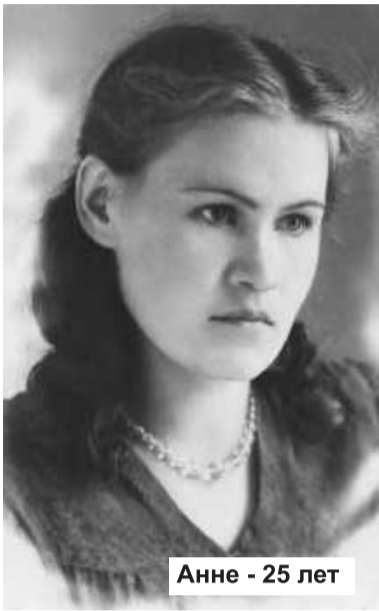
Анне - 25 лет

Как война началась, мне 15 лет было, но я уже всю вкалывала в колхозе. Господи, что только ни делала! Прицепщиком работала, пахала, жала, косила... Косить научилась в 11 лет. Потом две зимы на лесозаготовках вместе с мужиками валяла громадные сосны. Война все перевернула. Одного брата