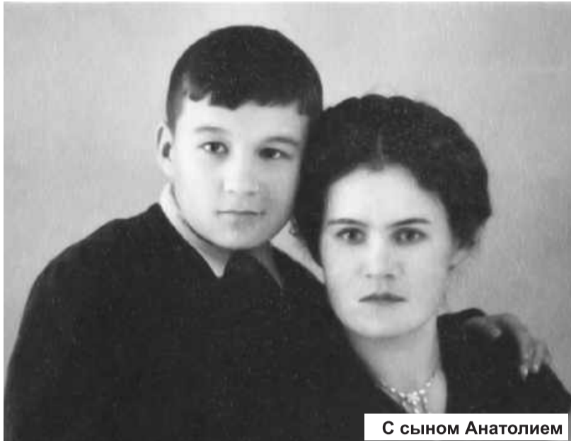
С сыном Анатолием