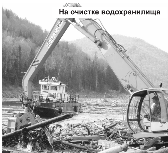
На очистке водохранилища

Бежит по рельсам трамвайчик. Торопится доставить пассажиров на конечную остановку – ГЭС. В салоне всего-то несколько человек – час пик прошел. Остальные его собратья отдыхают в депо, где нет затишья в течение всего рабочего дня. Здесь меня