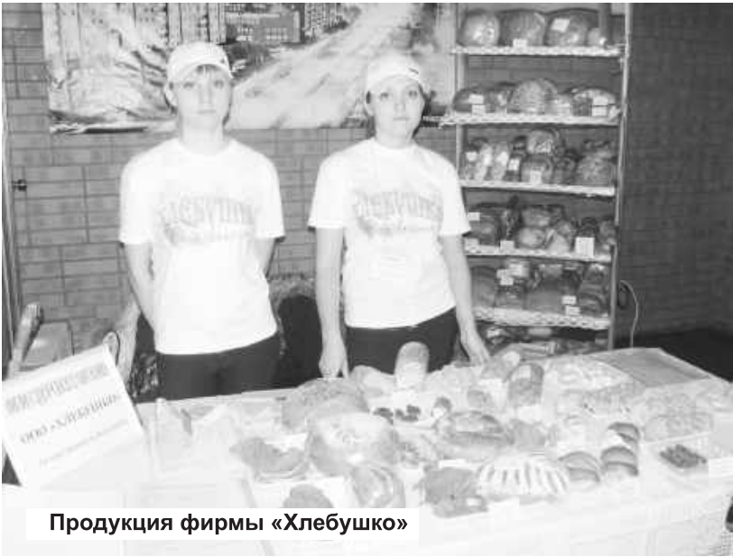
Продукция фирмы «Хлебушко»

каравай дружбы, который следует отщипнуть, угоститься и тем самым приобщиться к радостному событию. В добрый путь, выставка!