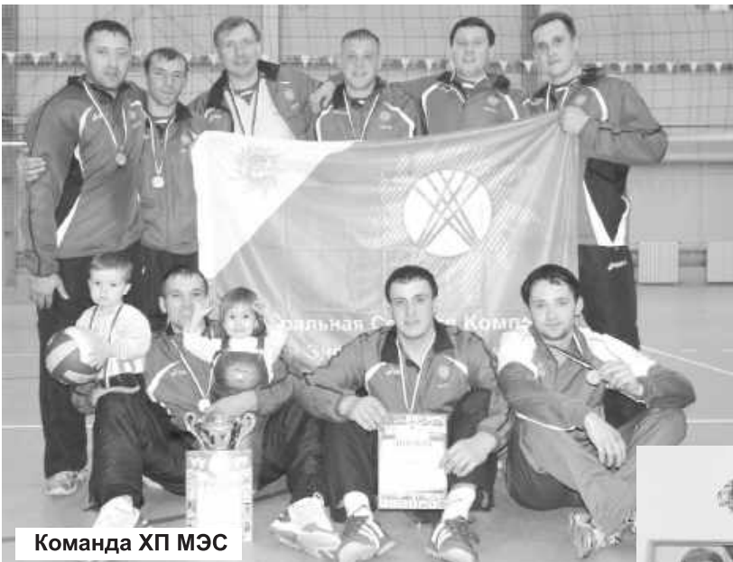
Команда ХП МЭС