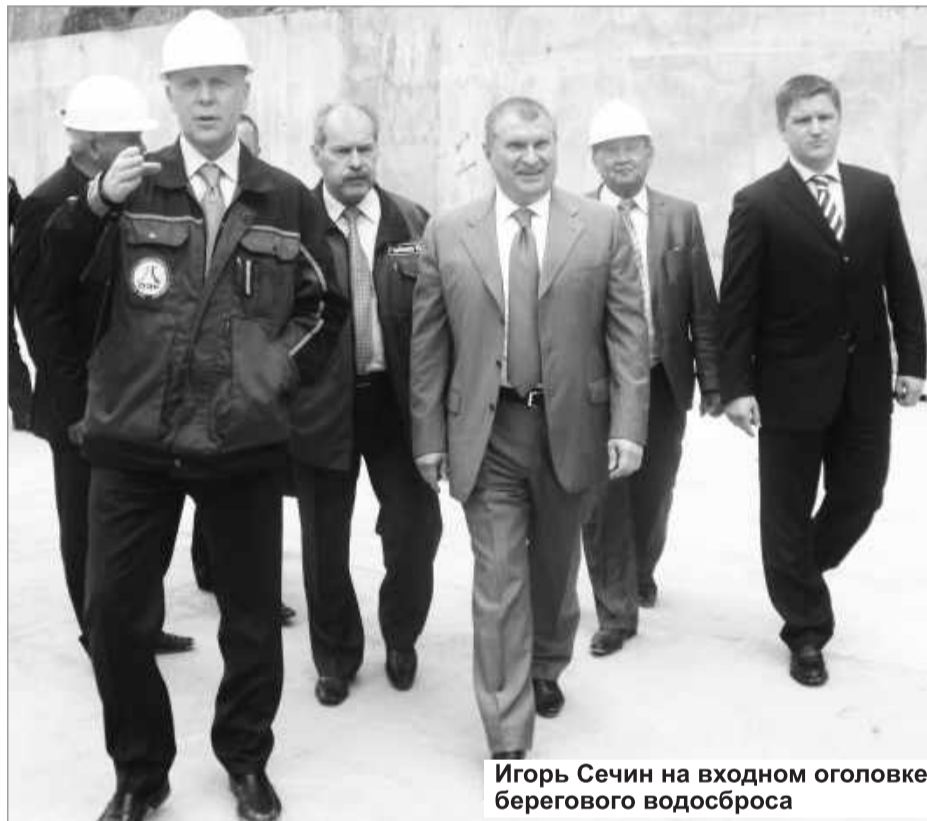
Игорь Сечин на входном оголовке берегового водосброса

С высоты смотровой площадки открылась картина строительства. Несколько рабочих чистили водобойный колодец под четвертой плотинной каскада, работали кран и самосвал. Ничто не отвлекало строителей и гостей праздника от обзора уникального сооружения неподалеку от величественного сооружения Саяно-Шушенской ГЭС.