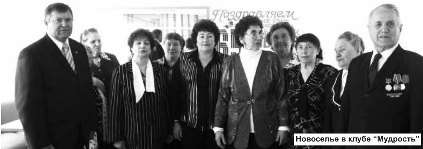
Новоселье в клубе «Мудрость»