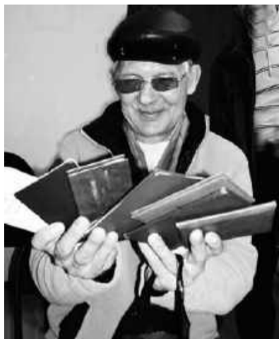
Больше специальностей – больше шансов