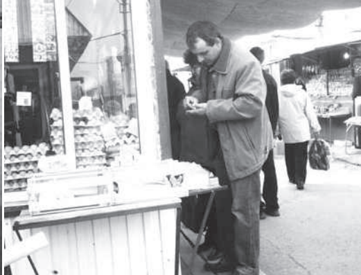
Как научиться искусству выбирать? Стр. 14