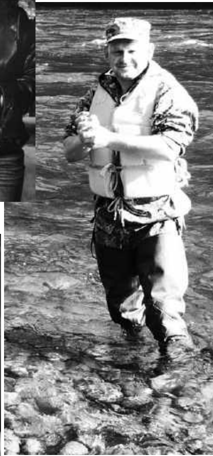
Иногда можно и отдохнуть