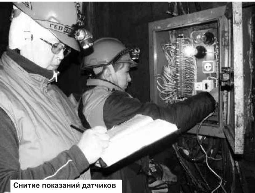
Снятие показаний датчиков

Многофакторные исследования – это и есть комплексный анализ. Группы геодезического, фильтрационного и телеметрического контроля в постоянном режиме занимаются оценкой состояния гидросооружения. Группа диагностики и сейсмометрии ведет базу данных информационно-диагностической системы и подготовку оценочной информации.