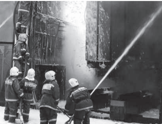
Самоотверженность проверяется в условиях опасности Стр. 8