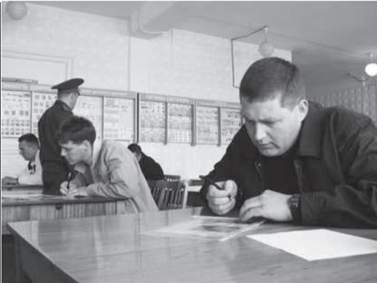
Конкурс водителей начался с теории Стр. 10