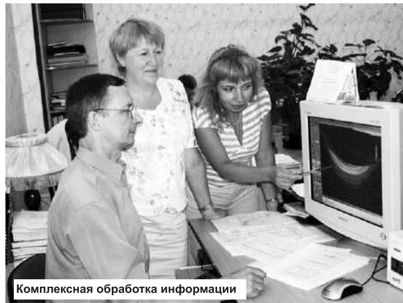
Комплексная обработка информации