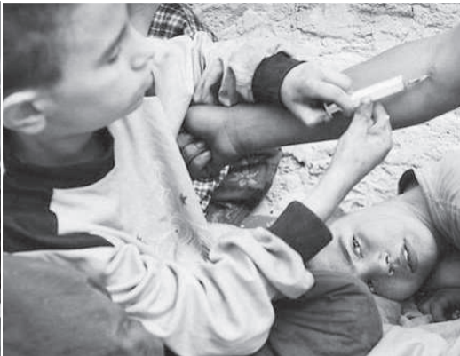
Наркотик дарит сладкий сон, иллюзию... Стр. 12