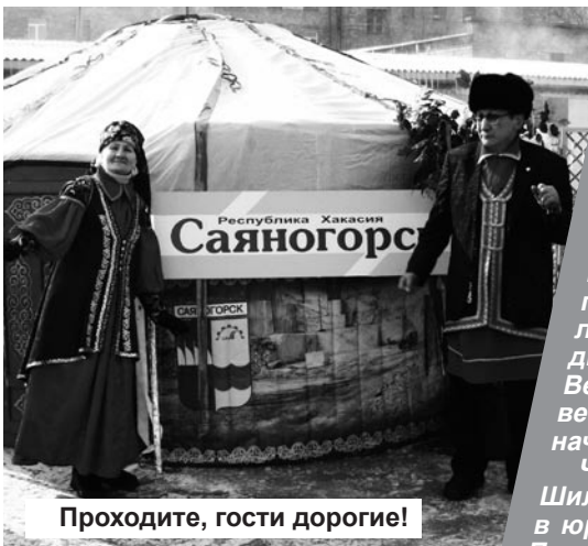
Проходите, гости дорогие!