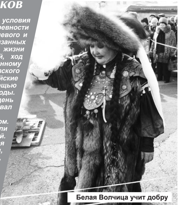
Белая Волчица учит добру

По материалам книги Виктора БУТАНАЕВА «Народные праздники Хакасии»