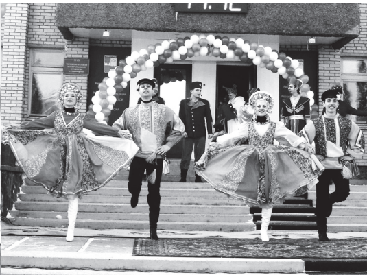
Праздник тех, кто организует наш досуг Стр. 7