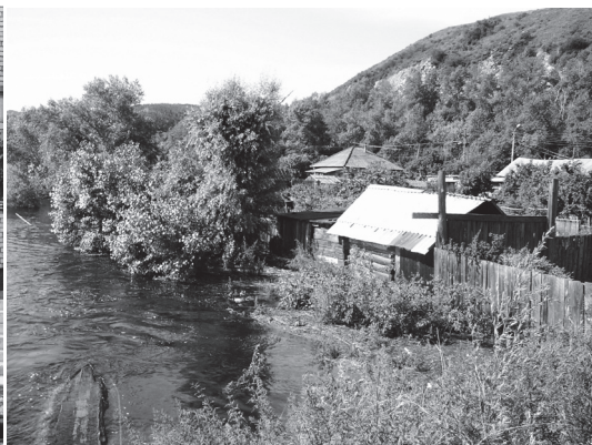
Подготовьте подворье к паводку Стр. 12