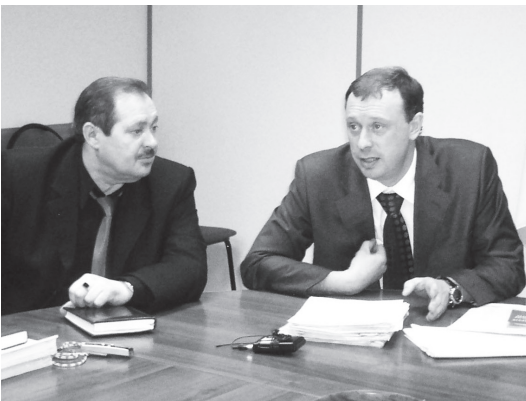
Зачем приезжал главный жилищный инспектор? Стр. 3