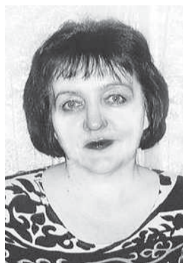
Новое поле коммунального быта изучала корреспондент Валентина ЗНАМЕНОВА