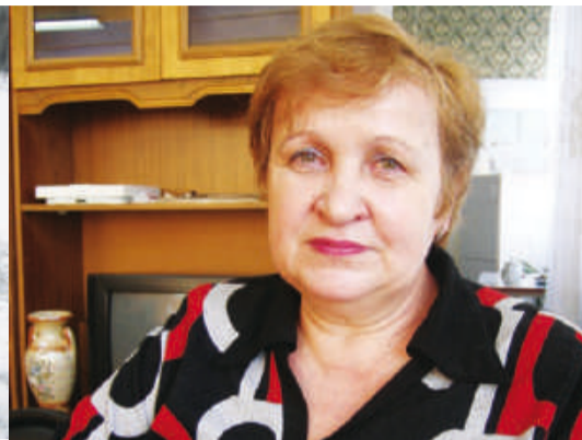
Имя Татьяна не кануло в Лету Стр. 18