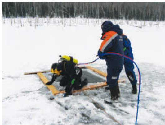
Спасатели подняли тело утонувшего рыбака Стр. 16