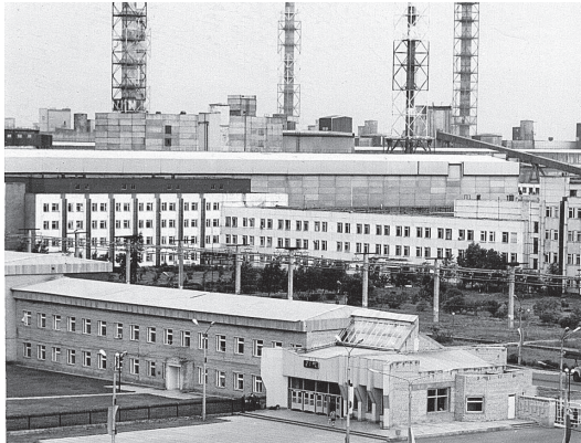
САЗ противостоит кризису Стр. 3