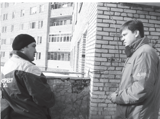
В Черемушках «Заря» занялась Стр. 7