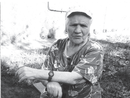
Пенсионеры: социальное самочувствие Стр. 8-9