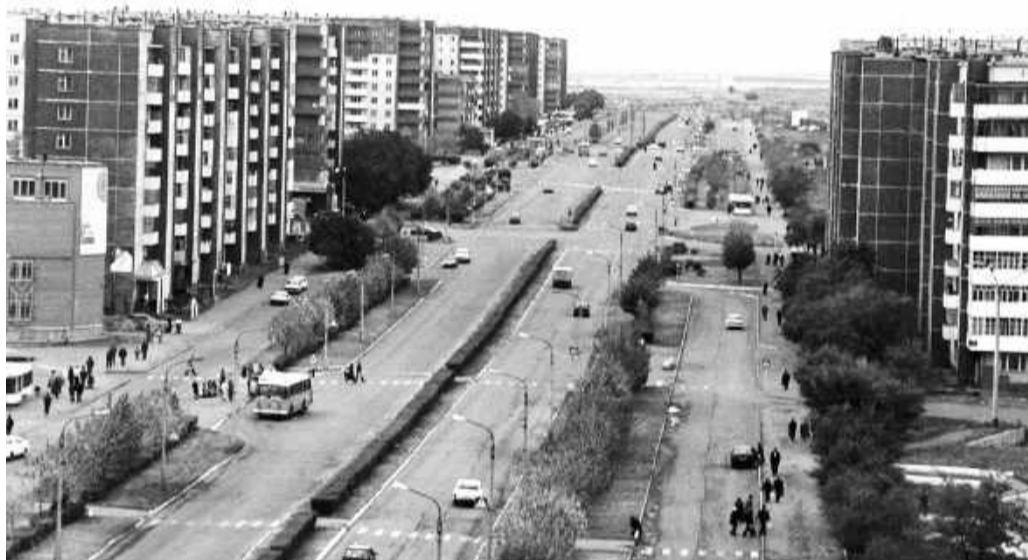
Публикуется на бесплатной основе

Друзья, наша цель - процветание родного города!!! ДМИТРИЙ БРАГИН