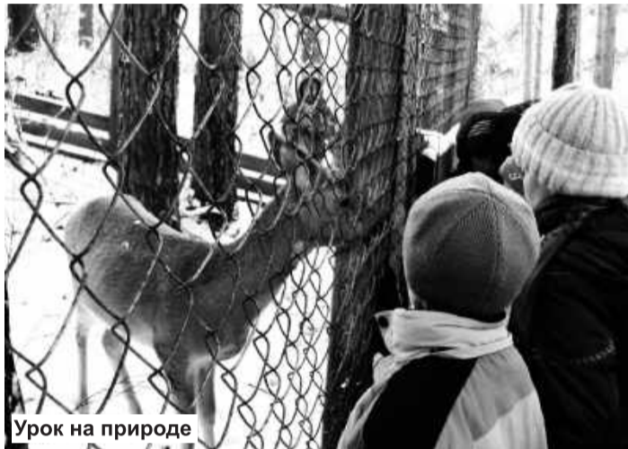
Урок на природе

Из экологпросветительских мероприятий оргкомитет по проведению акции назвал его основным. Участниками могут быть дети (начиная с дошкольного возраста), студенты, коллективы организаций и предприятий, ТСЖ и управляющие компании, журналисты... Условиями конкурса предложено семь номинаций, каждая из которых несет воспитательную нагрузку, направленную на повышение экологических знаний и культуры.