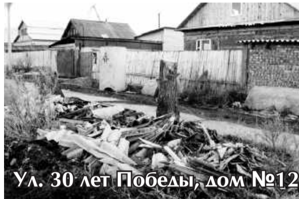
Ул. 30 лет Победы, дом №12

Крышу шифером новым покрыли, А старый - побитый - к дороге свалили. Газон бы разбить на обочине той, Но лишь отходы лежат здесь горой.