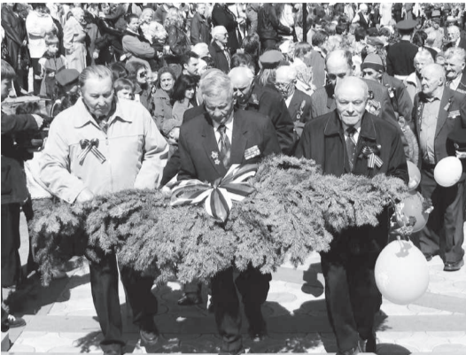
Исторической памяти не угаснуть