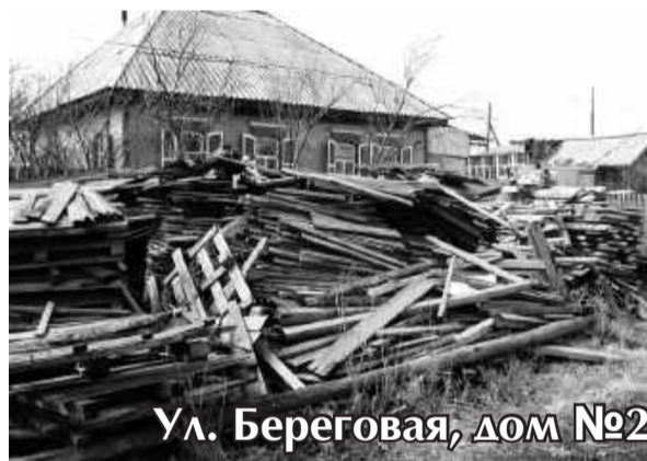
Ул. Береговая, дом №2

Здесь сложены шпалы, доски, навоз... Чтоб вывезти все, не управится воз. От навоза вонь окрест валит валом... Что ж, нюхайте все, причем - даром. Мало того - у забора свалка, Хозяйке, видно, и дом не жалко. Мусор дымит под столбом... Что раньше сворит - электроопора иль дом?