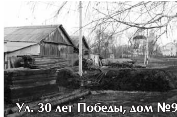
Ул. 30 лет Победы, дом №9

Крышу шифером новым покрыли, А старый - побитый - к дороге свалили. Газон бы разбить на обочине той, Но лишь отходы лежат здесь горой.