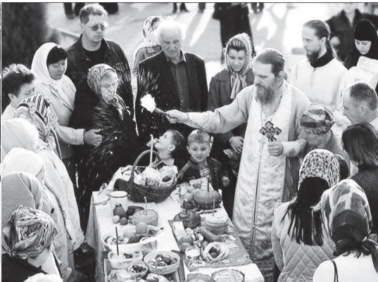
С праздником Светлой Пасхи!