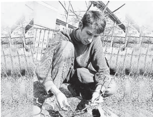
Пора оценить перезимовавший саженец