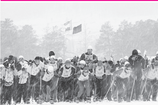
«Лыжня России-2009» Стр. 2