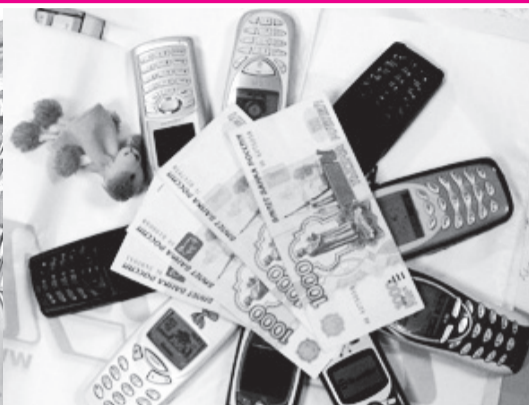
Мошенничество по телефонам Стр. 12