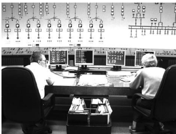
Материалы подготовлены пресс-службой филиала ОАО «РусГидро» - «СШ ГЭС имени П.С. Непорожного»

Конечной целью внедрения системы является получение Сертификатов соответствия международным стандартам, получение которых планируется в 2010-2011гг.