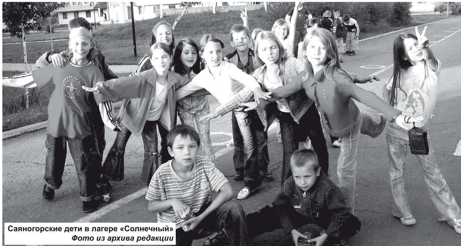
Саяногорские дети в лагере «Солнечный»

В течение лета оздоровятся 252 ребенка из малообеспеченных семей - на 40 больше, чем в прошлом году