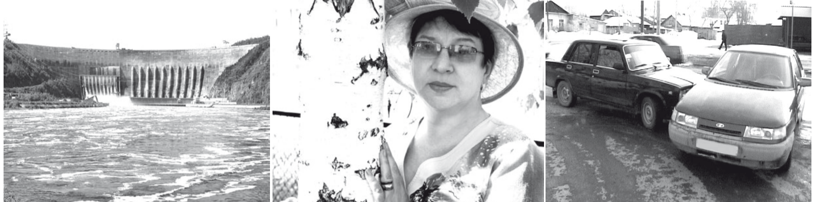
Наполнение водохранилища СШ ГЭС идет по графику Стр. 3

В пришкольном лагере Майны отдыхают 139 ребятшек стр. 7