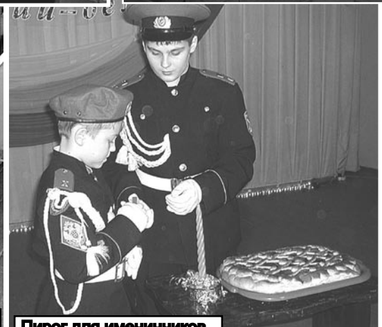
Пирог для именинников