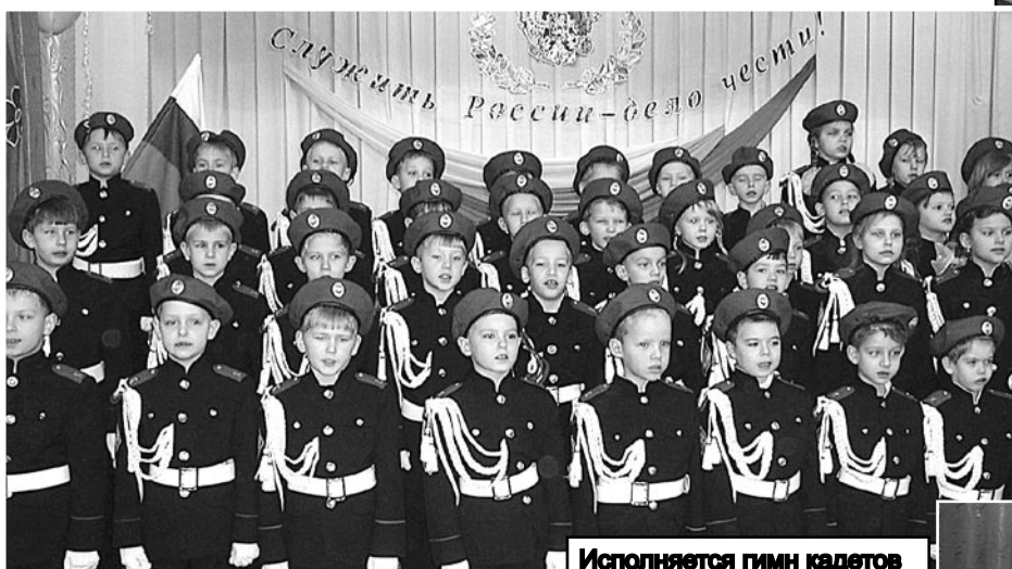
Исполняется гимн кадетов

Школа выдержала свой трехгодовой экзамен по избранному