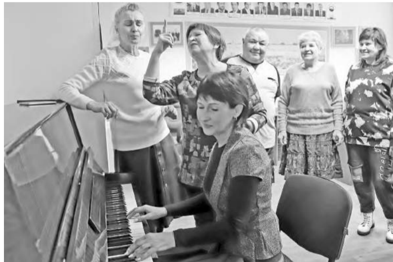
Коллектив совета ветеранов САЗа и в творчестве хорош!

- У совета возникла идея - создать свой гимн. В нашем