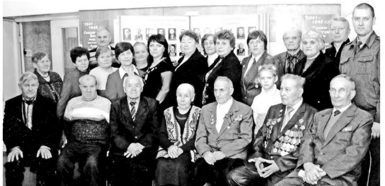
Фото на память в день открытия Зала боевой славы (8 февраля 2013 года)