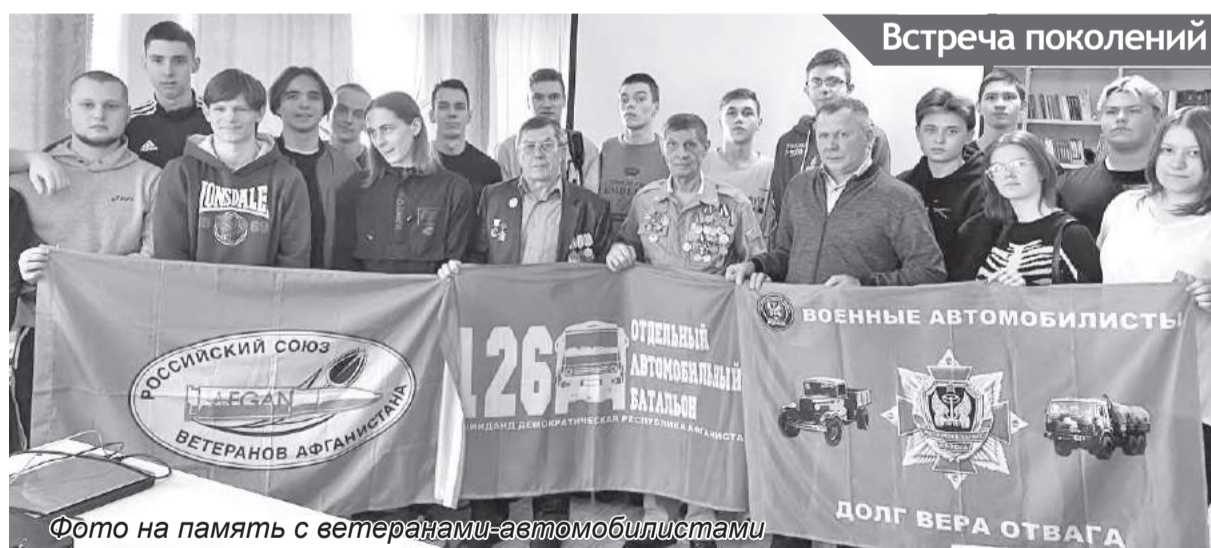
Фото на память с ветеранами-автомобилистами