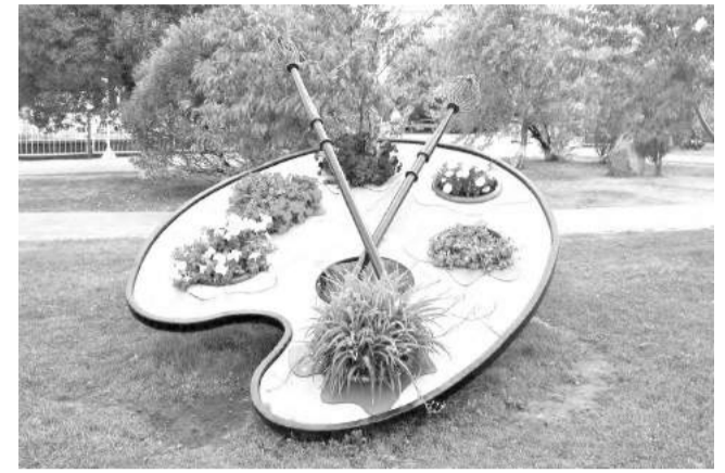
Выбор одного из трёх арт-объектов - за вами: «Мольберт и рамка картины», «Скамейка с гитарой» и «Палитра с цветами»

ными возможностями здоровья. На данном объекте будет смонтировано шесть осветительных установок серии «Стрит» (уличные светодиодные светильники), восстановлено два фонаря на существующих там железобетонных опорах.