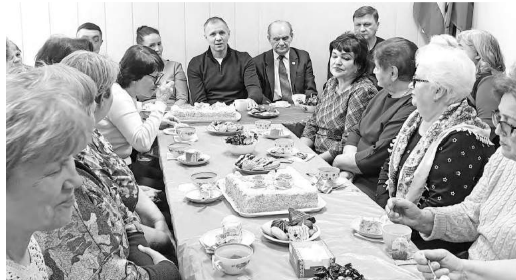
Душевный разговор за чашкой чая

шенно спонтанно, председатель Общественной палаты дал слово всем, кто хотел поблагодарить милых женщин, отметить, похвалить.