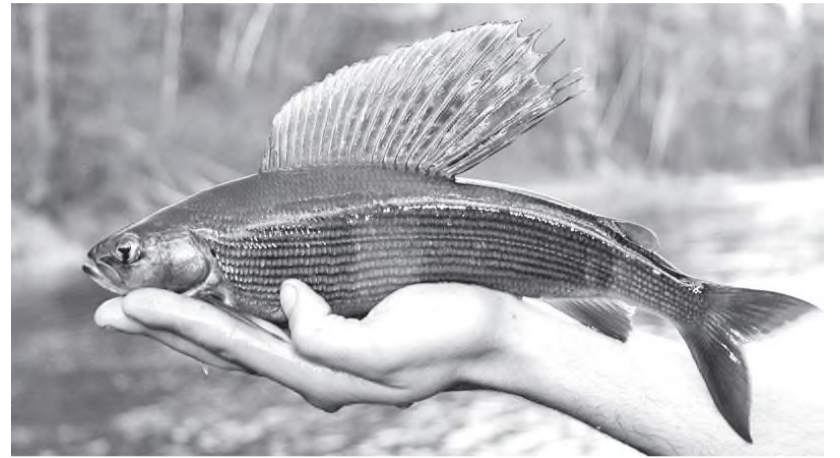
Ловись, ловись, рыбка!