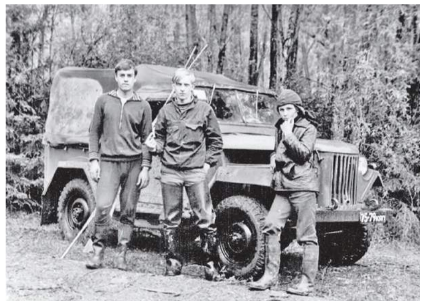
У реки Джой в устье Клая (май 1981 года)

Хариус - довольно чуткий и осторожный вид рыбы. При малейшем шорохе он может испугаться. Ловить его можно на камнях, зайдя в воду, чтобы не создавать лишнего шума. Забросы нужно делать по течению, двигаясь вниз к перекату. Ловить лучше после первой половины дня или же ближе к вечеру (в сумерках).