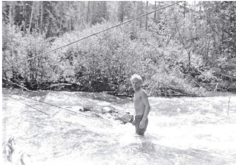
Переправка в 1982 году мотоцикла через Клай во время «большой воды» с помощью фалов (страховочных канатов)

Все восторженно загалдели и пошли по стволу на другую сторону речки. Таинственное всегда манит, и через полчаса наша компания остановилась около древнего божества. Как заколдованные, стояли мы перед вертикальной ровной скалой с выступом в виде козырька, который закрывал от дождя и солнца первобытный «иконостас». На плите и нижней стороне козырька были нарисованы скорее всего охрой большие и малые личины божеств. От писаницы, выполненной первобытным человеком несколько