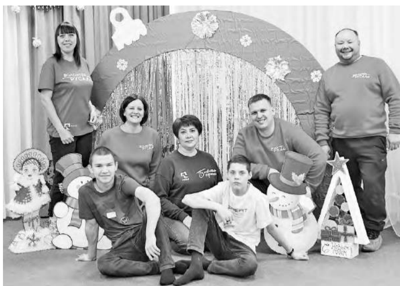
Фотозона от команды «Чудеса» в детском доме «Ласточка»

С подробной информацией о реализации программы можно ознакомиться на сайте Минстроя РХ в разделе «Интересно и полезно», далее «Вопрос - ответ» или проконсультироваться по имеющимся вопросам в администрациях муниципальных образований республики.