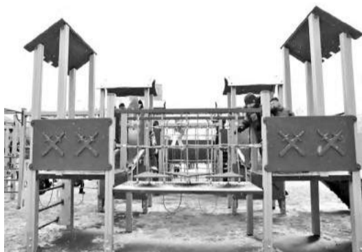
Целый день мы прыг да скок, любим детский городок!