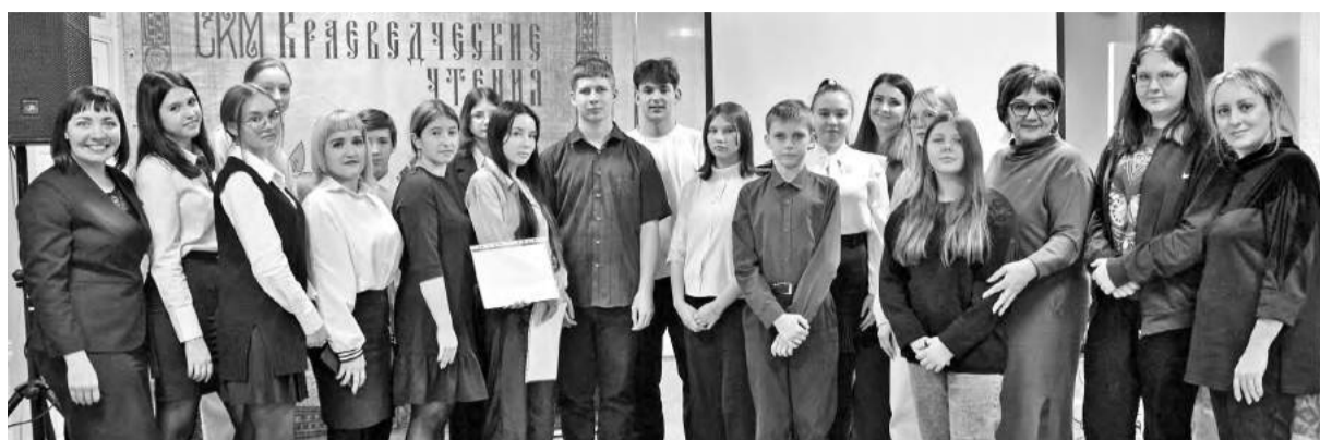
Краеведы - исследователи истории родного города

С приветственным словом к собравшимся обратились