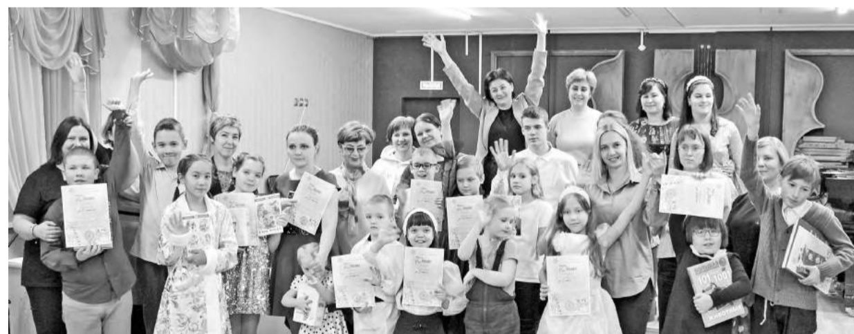
Умело зажигал зал каждый участник концерта