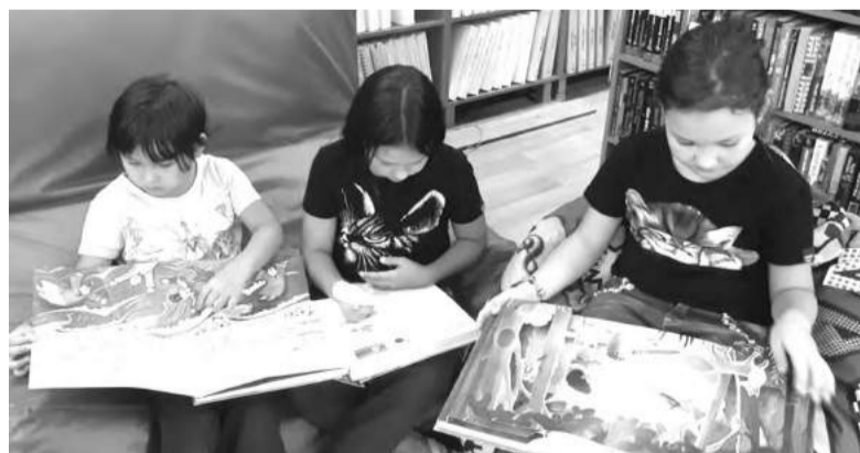
Эти книжки завораживают

«Сказки народов России» знакомит юных читателей с преданиями народов, проживающих по берегам великих рек России. А обучающий комплект «Путешествие по странам и континентам» рассказывает о Греции, Египте, Перу, Иране, Корее и других странах.