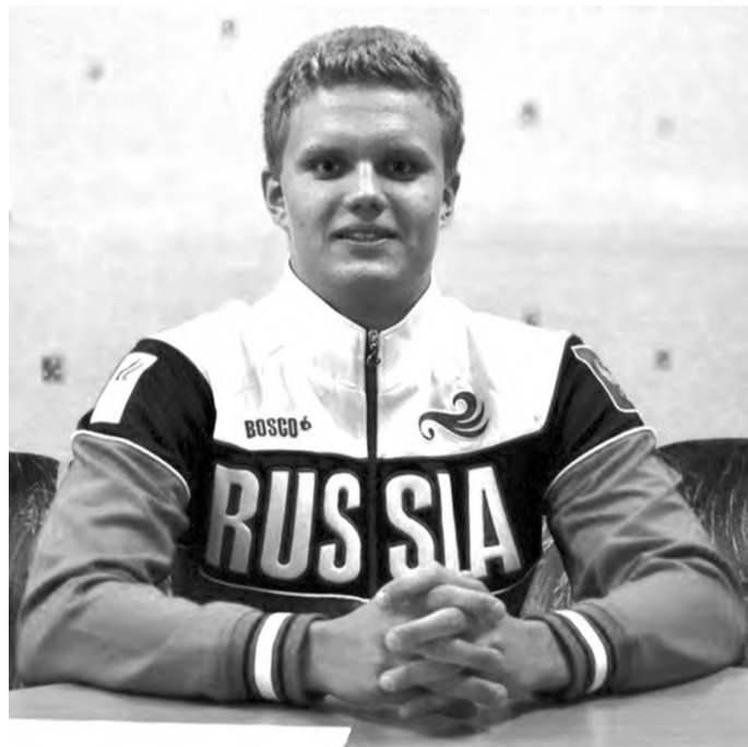
Гордость Саяногорска и всей страны