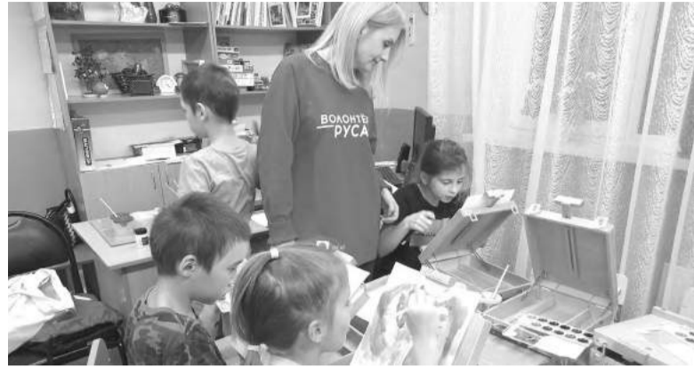
Так рождается волшебство...

Ранее волонтеры ИСО вместе с ребятами провели мастер-классы, посвящённые Дню учителя и Правилам дорожного движения. По