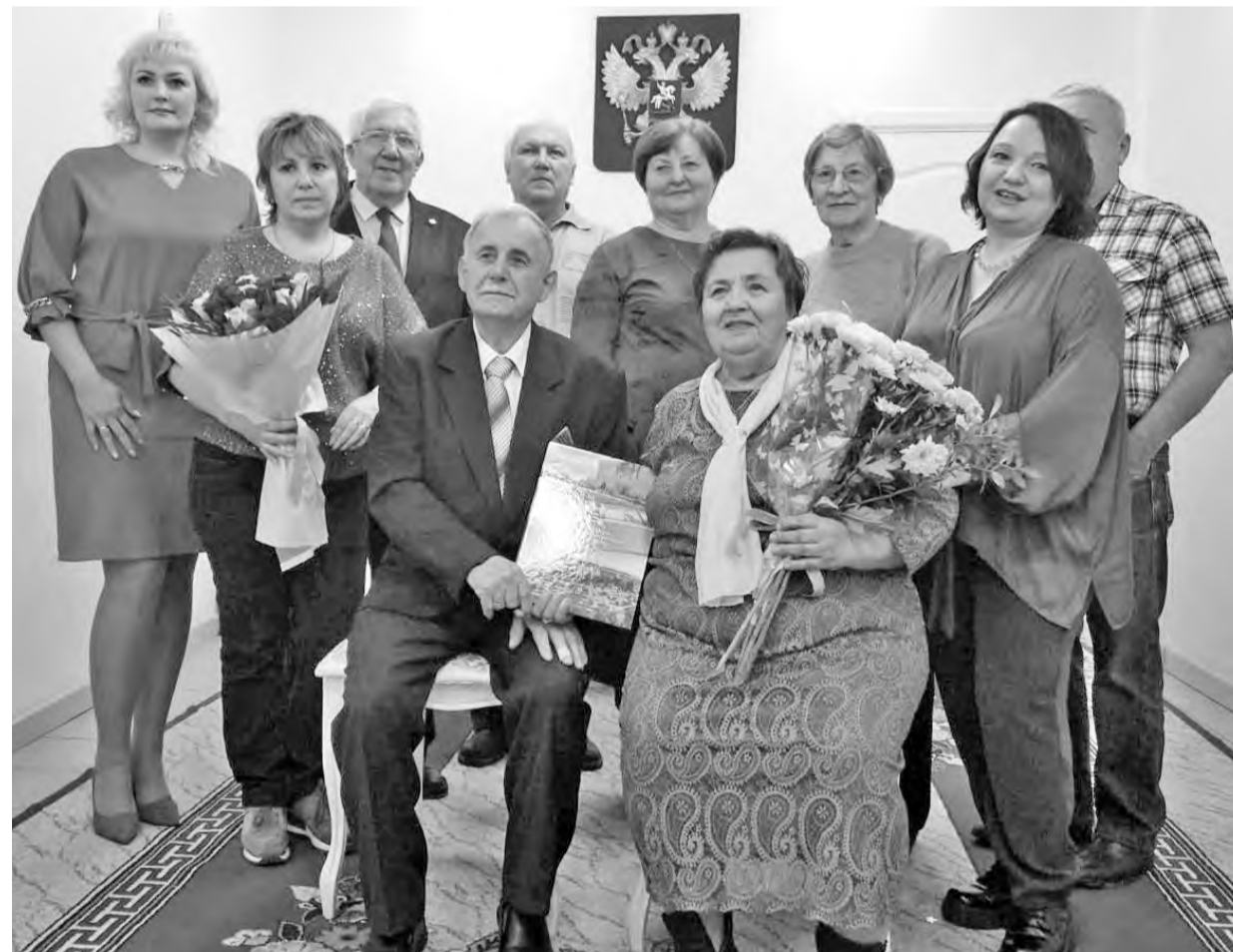
...и 60 лет спустя на церемонии в загсе в кругу родных и близких

pronизанного взаимным уважением и усердным трудом на благо близких, уложились, что называется, на подкорку.