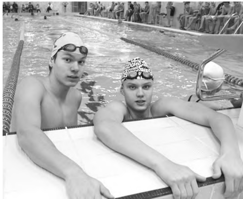
На соревнованиях с товарищем по «Алым парусам»