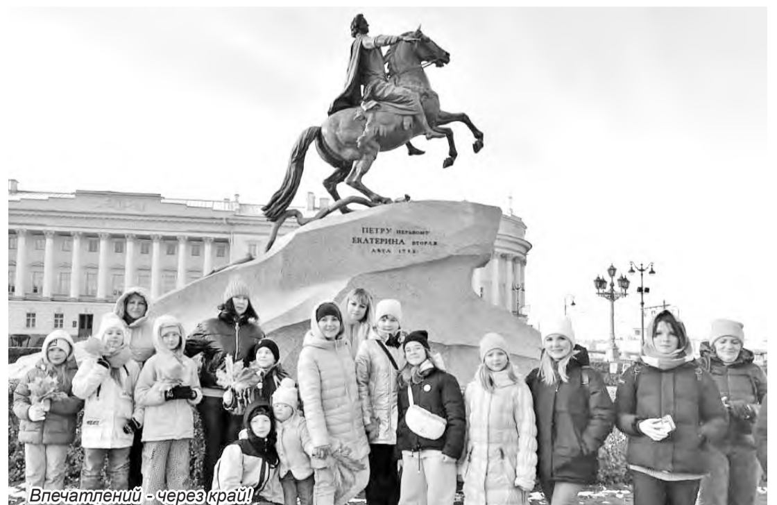
Впечатлений - через край!

Перед конкурсным выступлением саяногорцы приняли участие в мастер-классах по вокалу и вокальному ансамблю, сценической речи, художественному слову и сценическому поведению под руководством председателя жюри конкурса - доцента Санкт-Петербургского государственного института культуры,