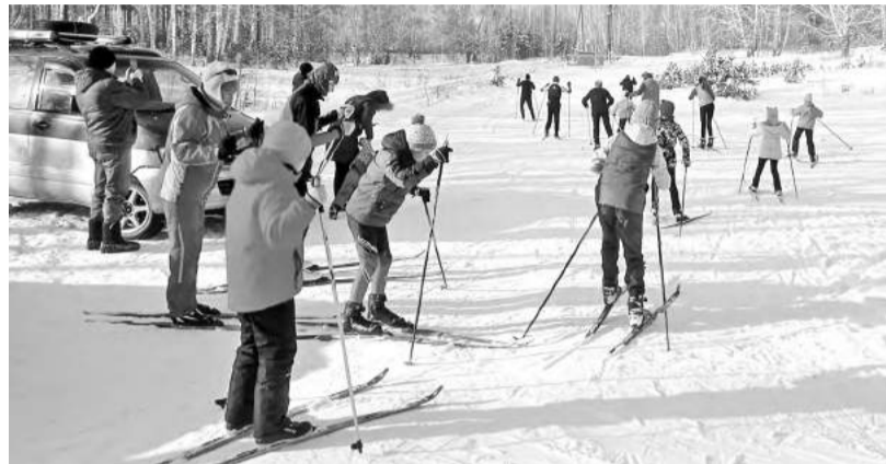
Лыжня, комфортная для всех (ноябрь 2023 г.)