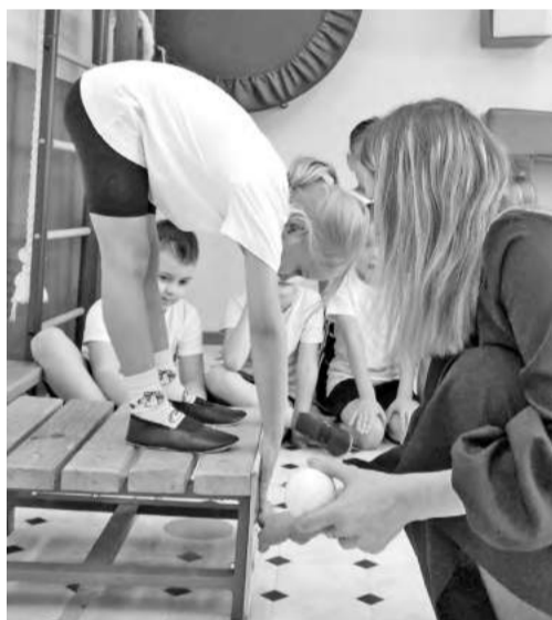
Тянемся за медалью!