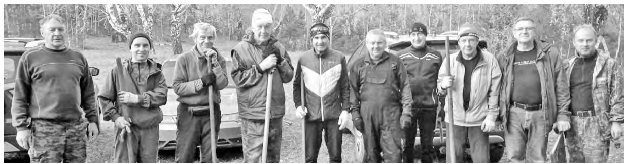
К началу работ по прокладке лыжной трассы готовы (август 2023 г.)

Лыжную трассу в майнской зоне отдыха протяжённостью почти три километра для вас готовили, начиная с августа. Как рассказал зачинщик этого дела, расчистка будущей трассы началась с вырубки кустарников и мелколесья. Затем в работе были задействованы грейдеры город-