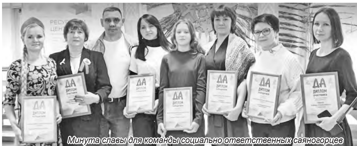
Минута славы для команды социально ответственных саяногорцев

Одним словом, Ресурсный центр НКО - это «посредник», помогающий представителям некоммерческих организаций и гражданским активистам творить добро, находить свою нишу в деятельности, направленной на решение социально значимых проблем, делать мир вокруг себя уютнее, красивее, богаче на положительные эмоции.