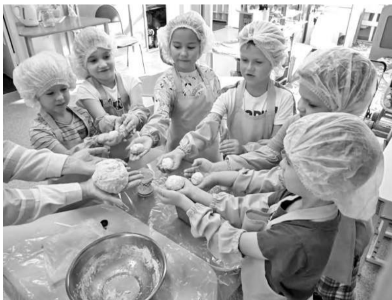
Я люблю готовить тесто. Это очень интересно!

Завершением тематической недели стало итоговое занятие «Хлеб - всему голова», на котором воспитанникам детского сада рассказали, что мука бывает разных видов в зависимости от зерновых культур: пшеничная, ржаная, рисовая, гречневая, овсяная и другая. А ещё ребята попробовали на