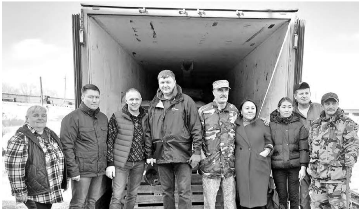
Для отправки груза на фронт собрались

что агрегат родом из страны Советов сносу не будет).