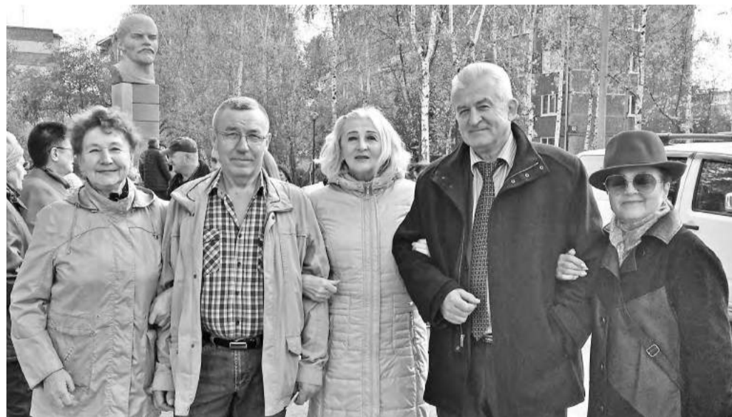
Саянмраморцы - особое состояние души!

Просматривая постфактум фотографии и видеоматериалы, невольно поймала себя на мысли, как же гармонично и слаженно протекало наше замечательное мероприятие! Это была атмосфера радости, культуры общения и доброжелательности.