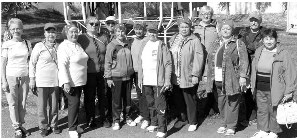
Затейники, умельцы, вдохновители - всё это члены клуба «Мария»

Два года минуло, как бессменный лидер «Марии» покинула этот мир, а ныне клубом заве-