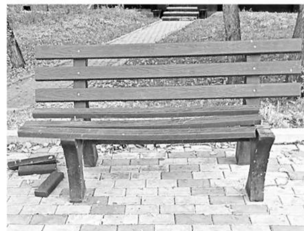
Удел ущербных: «Ну, лавка, погоди!»

Добывает и тот факт, что из окон квартир сразу