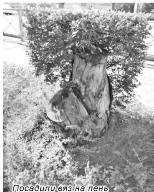
Посадили вяза на пень