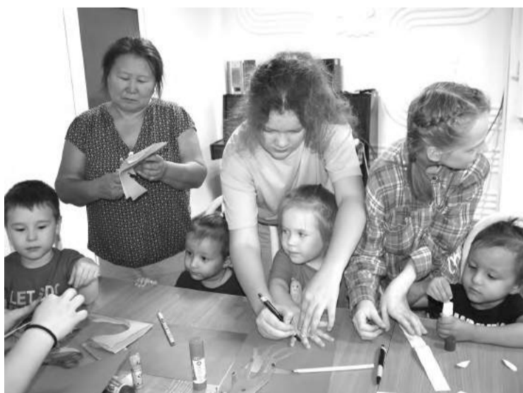
Ребятишек увлекла творческая работа

В роли наставников выступили старшие воспитанники студии «Саяночка». Они рассказали своим подопечным об основных правилах работы с разными материалами, куда входят лепка из солёного теста, бумагопластика, аппликация и игрушка «Зайчик на пальчик». Ребятишки с помощью друзей-волонтеров научились придавать обычной плоской бумаге объём, который делал поделку эффектной и уникальной. Надо было видеть, какие шедевры создали дети из солёного теста! Из-под их умелых