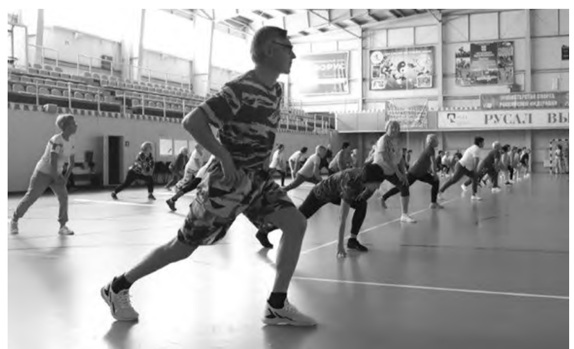
На зарядку становись!