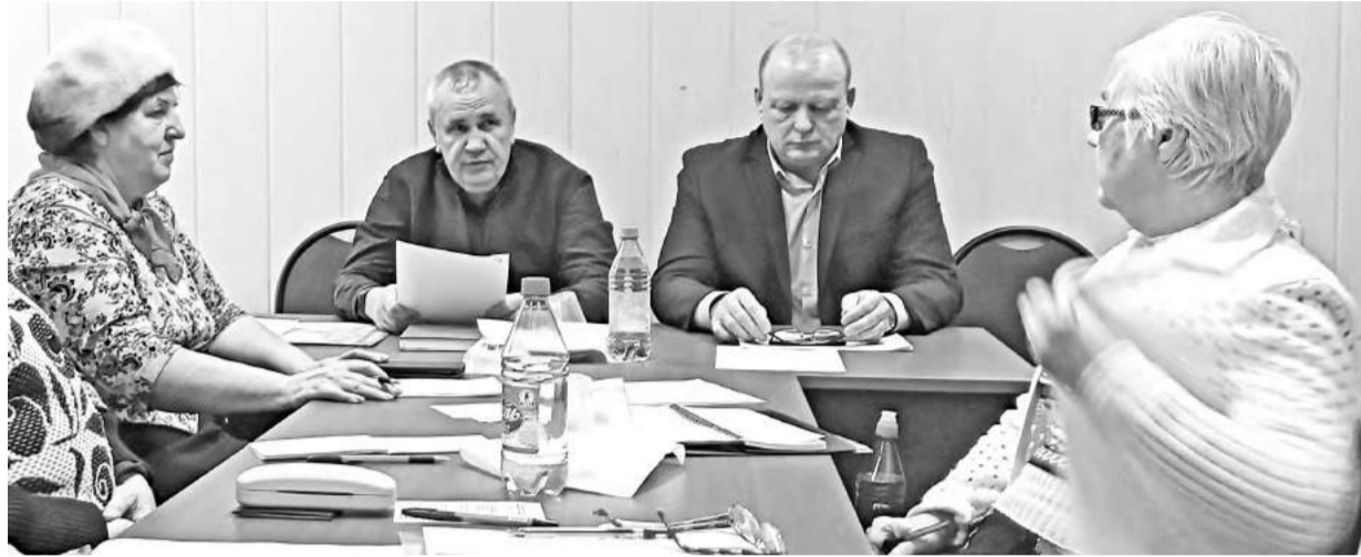
Все задачи решаем вместе!

живал все начинания общественности города, а затем уже в новом качестве продолжил это тесное сотрудничество.