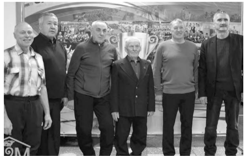
Старшее поколение по-прежнему в строю