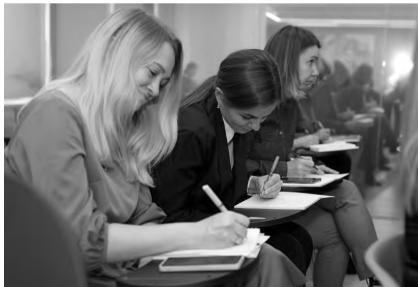
Семинар прошёл интересно

Центр «Атмосфера» в качестве площадки выбран неслучайно. В большом функциональном, уютном помещении для всех творческих и активных женщин города проходят мастер-классы, встречи, лектории, фокус-группы. Появился такой центр в городе благодаря компании РУСАЛ. И хотя открытие состоялось весной, пространство уже стало центром притяжения в городе.