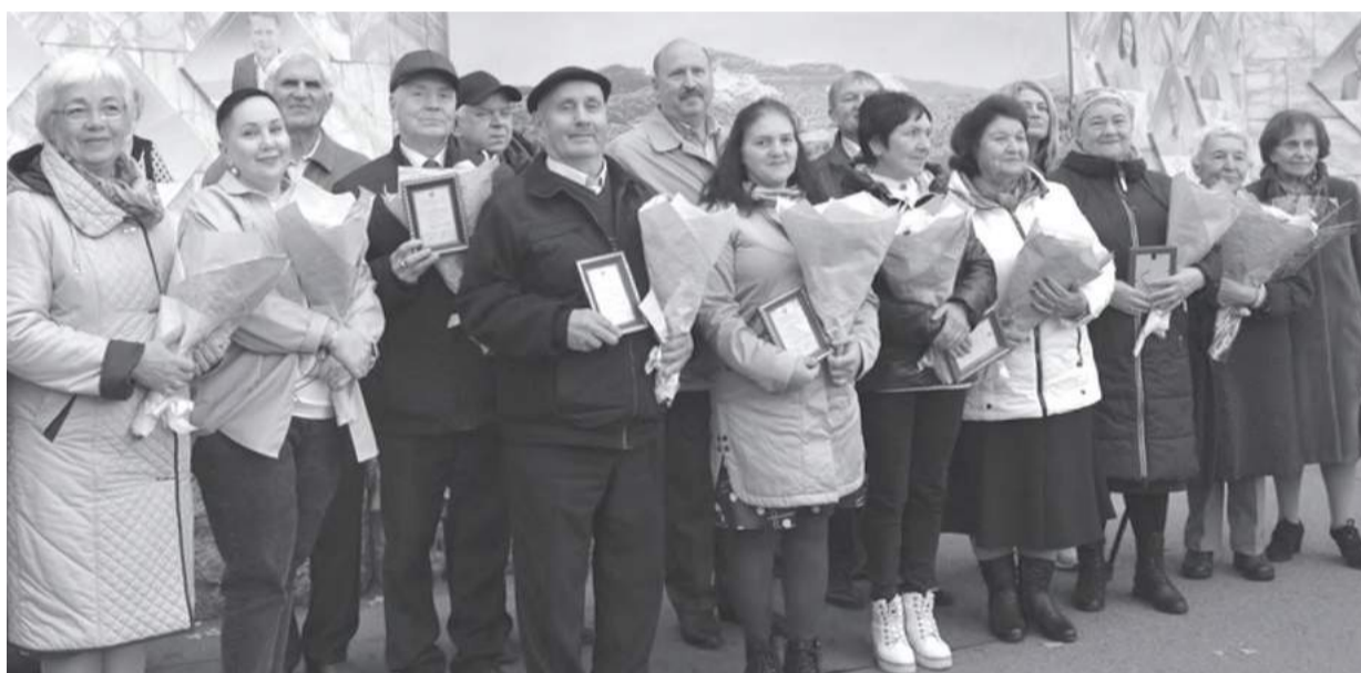
Вы - самые лучшие, потому что так решили трудовые коллективы

Занесённые на городскую Доску почёта люди проявили себя в профессиональной