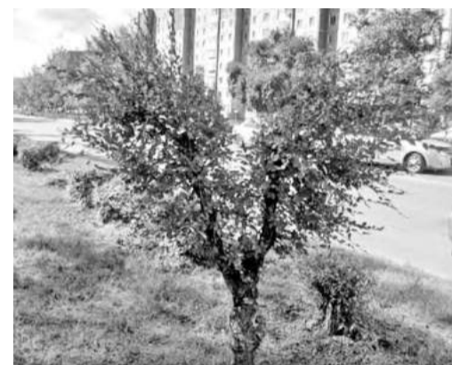
Присмотритесь - крылья ангела!