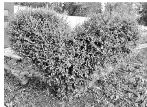
Чудесное сердечко. Правда?