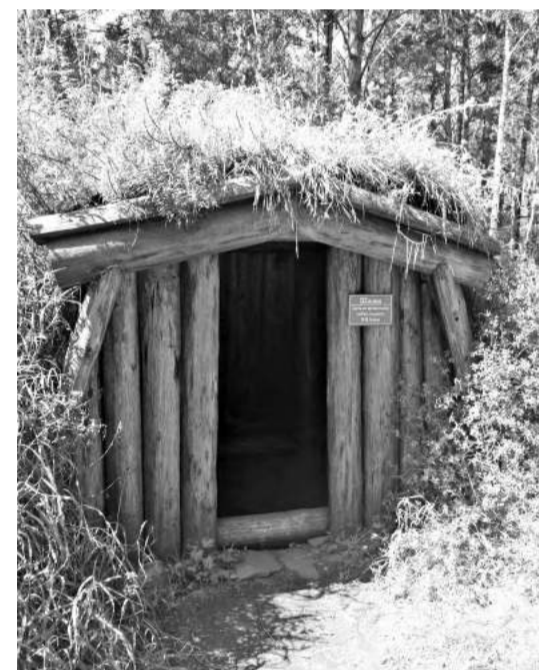
Заглянуть в историю сможет каждый

и других обитателей заповедника, оценили длину прыжков барса и козерога и сравнили со своими показателями, разглядывали величественных хищников в их естественной среде в специальный бинокль с встроенной видеозаписью фотоловушки и даже заглянули в тайное кошачье логово.