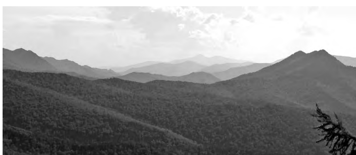
Вид на заповедную тайгу впечатляет!

В завершение экскурсии в зале кинолекториев результаты своих исследований по вопросам мониторинга загрязнения