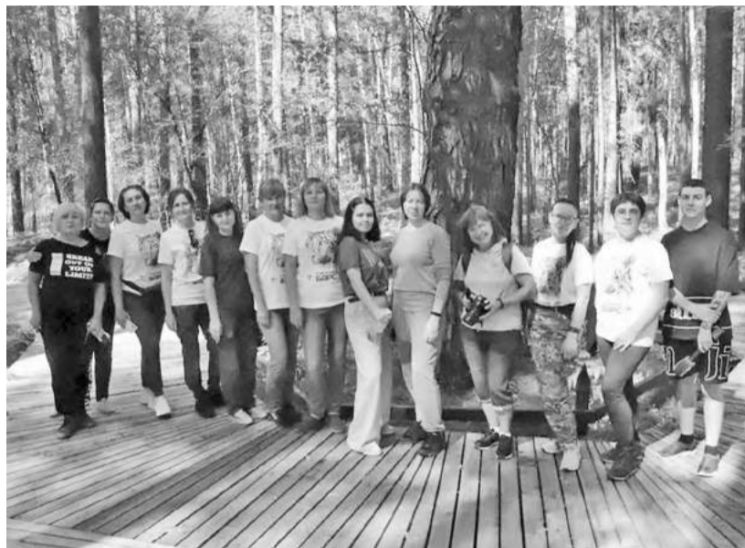
Памятное фото у 150-летней сосны, которая «видела» Ленина

Экспозиция музея увлекает и детей, и взрослых, воздействуя на разные органы чувств. Так, сразу на входе экскурсантам предлагают проштудировать «шпаргалку» - книгу фотографий редких видов животных и растений из Красной Книги Хакасии и России, а также проверить знания по сбору рюкзака и оценить свои силы, примерив 20-килограммовый выставочный экземпляр. Далее участники группы отдохнули на «привале» у почти настоящего костра, послушали аудиорассказы бывалых следопытов и голоса животных, помjali ладошками кинетический песок, изучая отпечатки следов барса, медведя, россомахи, козерога