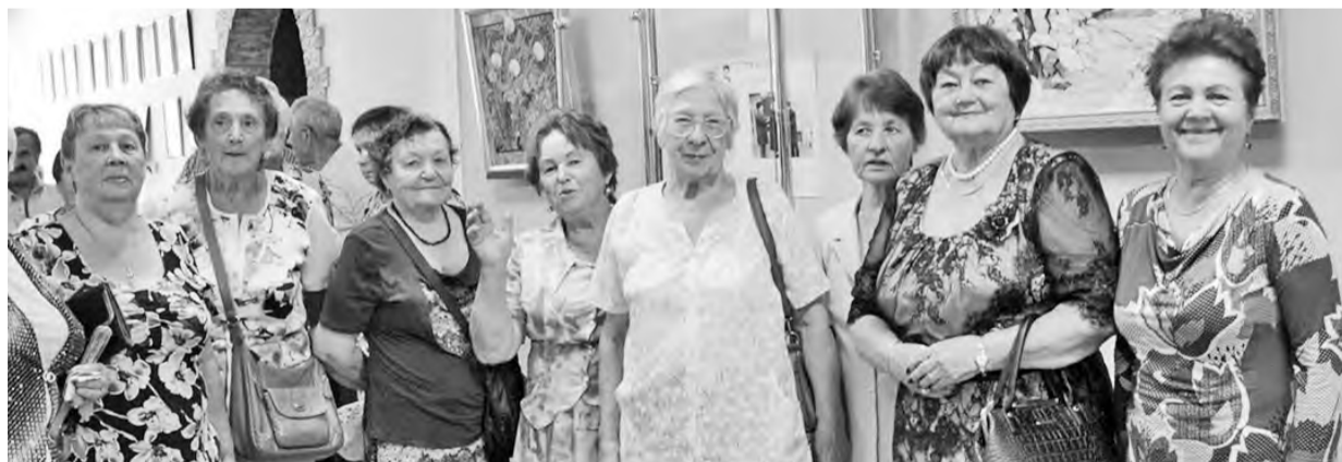
Удивительные работы саянских мастеров по мрамору привлекают на выставку многих горожан