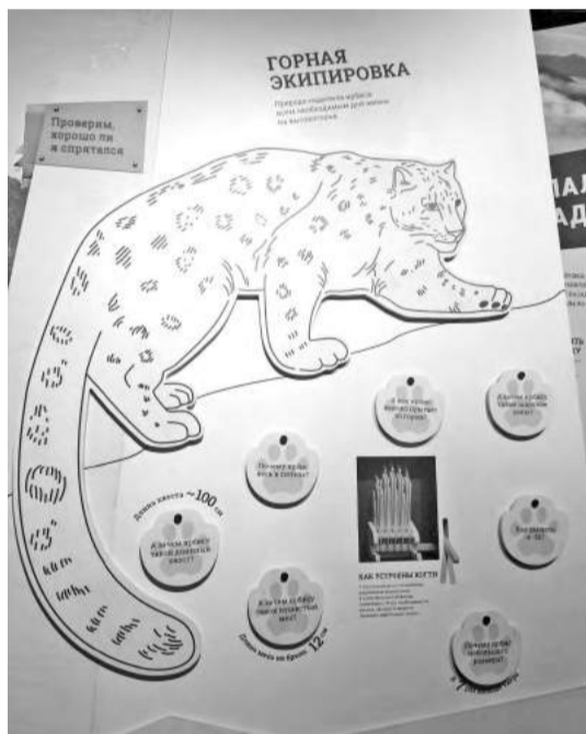
Саяно-Шушенский заповедник - место обитания самой северной группировки мировой популяции снежного барса