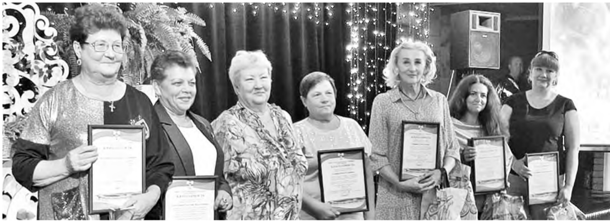
Минута славы - повод для улыбки