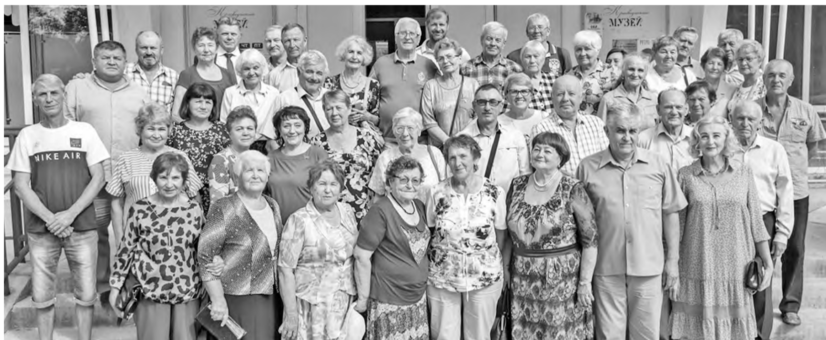
Вместе как в прежние годы!