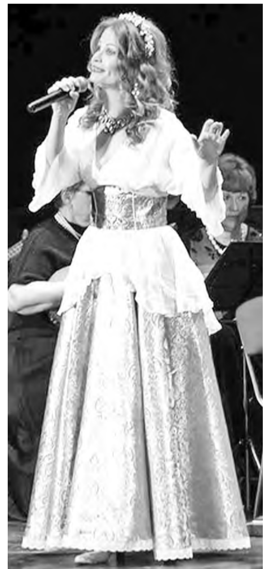
Артистка-вокалистка оркестра «Жемчужина России»