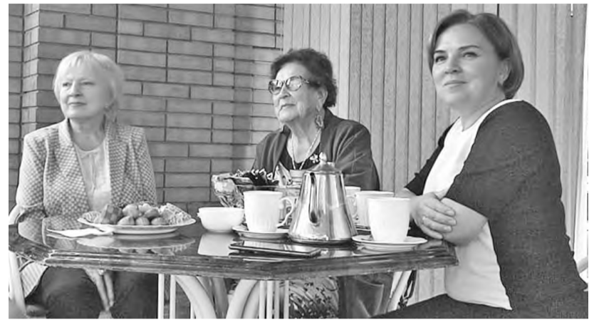
Почётные гости праздничного торжества