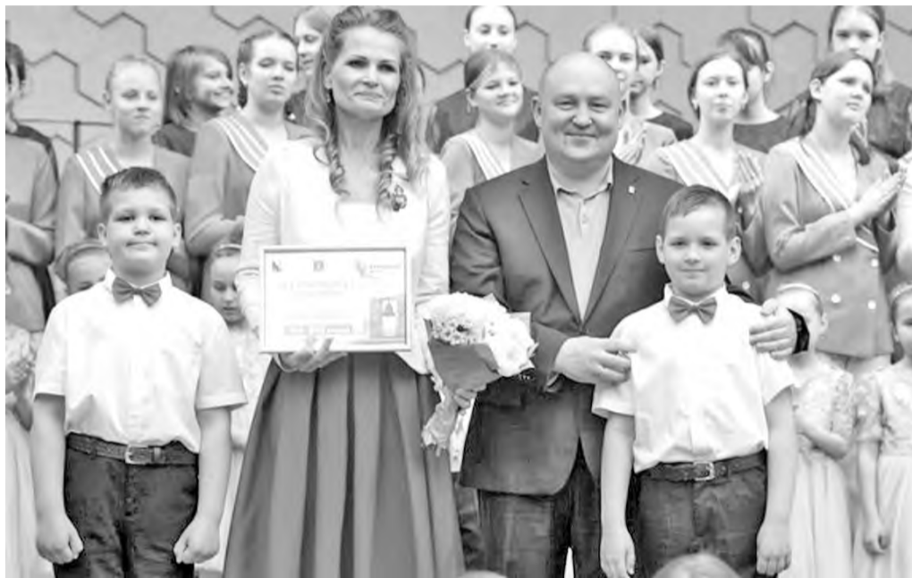
Награду за победу в конкурсе вручает Михаил Развожаев