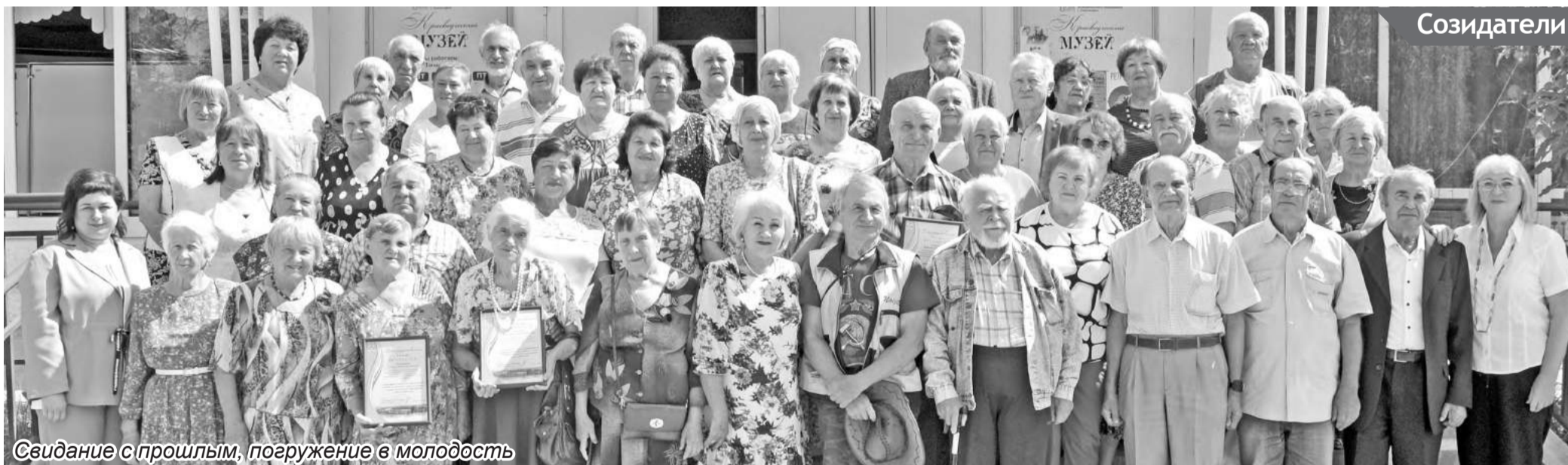
Свидание с прошлым, погружение в молодость

Творческие работы принимаются до 30 сентября в ДК «Энергетик», а потом их подарят маленьким воспитанникам Саяногорского реабилитационного центра.