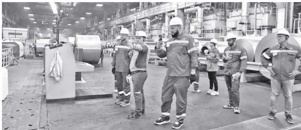
САЗ удивил технологиями экоактивистов

- Очень надеюсь, что в скором будущем КраАЗ будет, как минимум, похож на Саяногорский и Богучанский заводы. На САЗе всё очень познавательно, полезно и красиво. Спасибо большое! - прокомментировал представи-