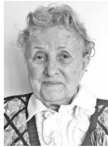
С Доски почёта и высоты прожитых лет