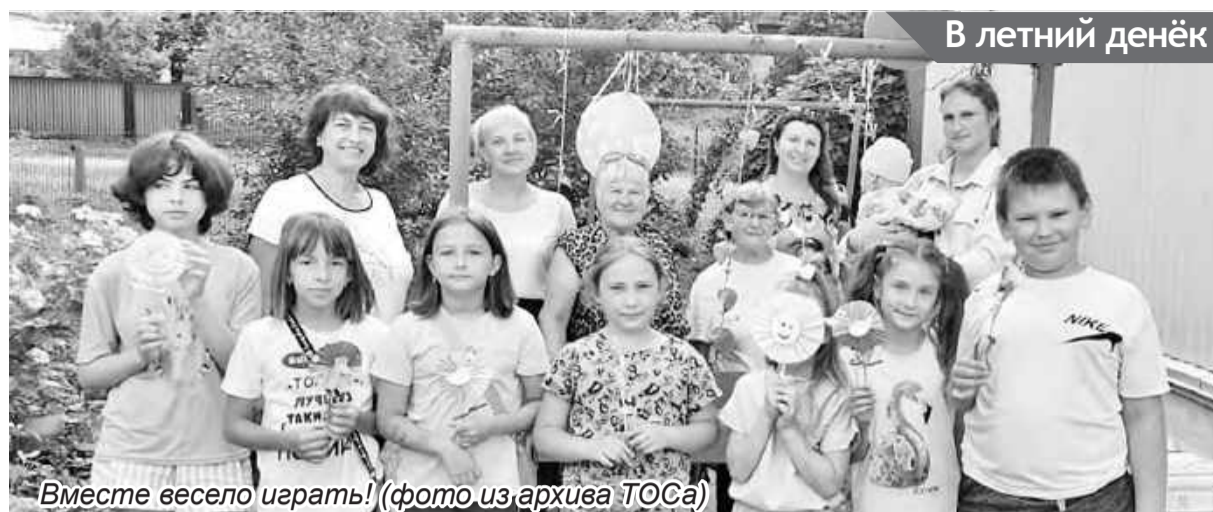
Вместе весело играть!