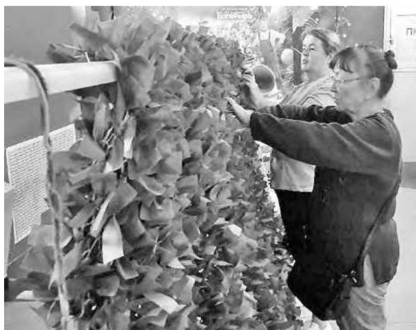
Маскети - защита бойцов!