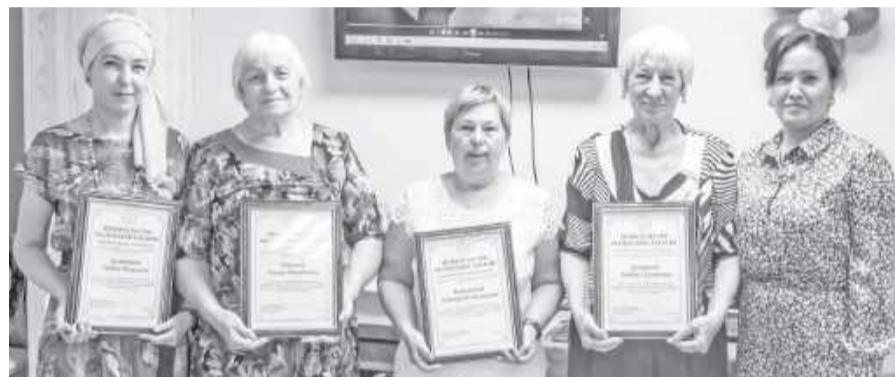
Приятно получить Благодарность Главы РХ!

Руководитель саяногорского комитета семей воинов Отечества рассказала о ходе сбора гуманитарной помощи в Саяногорске, о том, как происходит доставка груза и