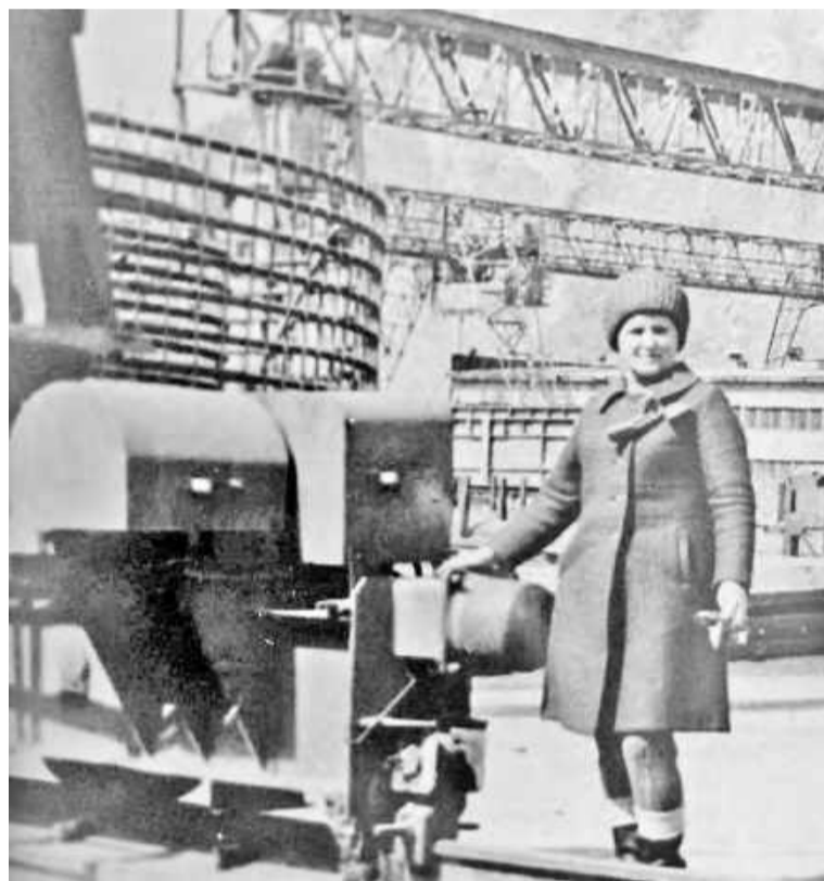
В своей родной стихии

умудрялась выращивать картофель из глазков очистков, а листья картофельных кустов мы обрывали и ели, предварительно ошпарив... Прибавьте сюда работу до изнеможения и злые морозы зимой. Как мы вытянули? Одному Богу известно.