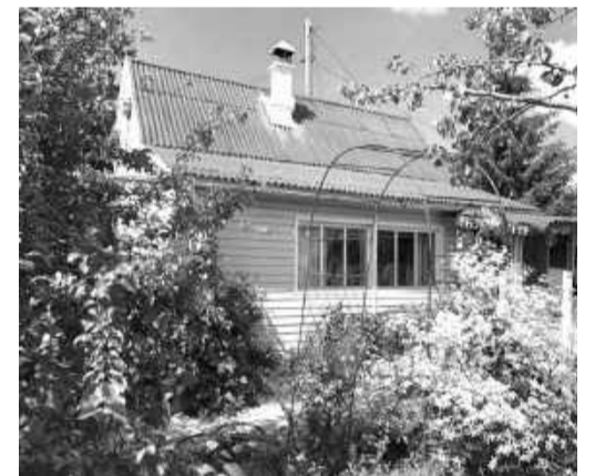
Дача - это жизнь за городом

плюс» - пятый по счёту. За всё время товарищество получило на развитие больше трёх миллионов рублей. Выделенных средств хватило на строительство новой линии электропередач по улицам Садовая, Энергетиков, Дорожников, Горняцкой и замену двух с лишним километров водопровода.