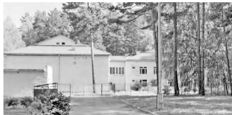
У поселковой детской школы искусств новая крыша

По словам директора Черёмушкинской детской школы искусств Светланы Баженовой, сегодня ремонт идёт полным ходом. Подрядчик зашёл на объект без нарушения сроков. В настоящее время уже полностью перекрыта кровля, установлены слуховые окна и новое пожарное ограждение, активно ведётся внутренняя отделка здания. В учебных кабинетах завершены работы по замене системы отопления, но продолжается замена электрики и сантехники, после чего будет выполнен косметический ремонт (всё