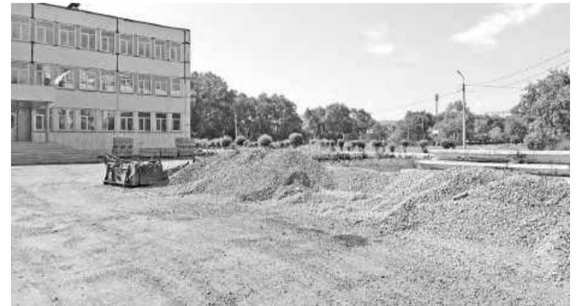
Замена асфальта на территории школы № 6

- На выполнение данных мероприятий из республиканского бюджета на демонтаж/монтаж/замену/ремонт/изготовление входной калитки на территорию объекта образования, установку системы домофона на детские сады выделен 1 миллион 30 тысяч рублей, на школы - 1 миллион 822 тысячи рублей.