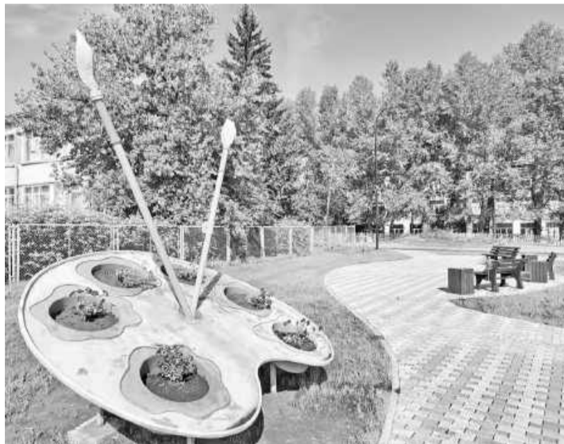
Палитра - украшение сквера

города над «продавливанием» крупных проектов, один из которых - реконструкция очистных в посёлке Черёмушки, по которому уже получена госэкспертиза. В сумму, заложенную на реализацию этого проекта, попадает и посёлок Майна с ремонтами коллектора, дорог и спорткомплекса «Юность».