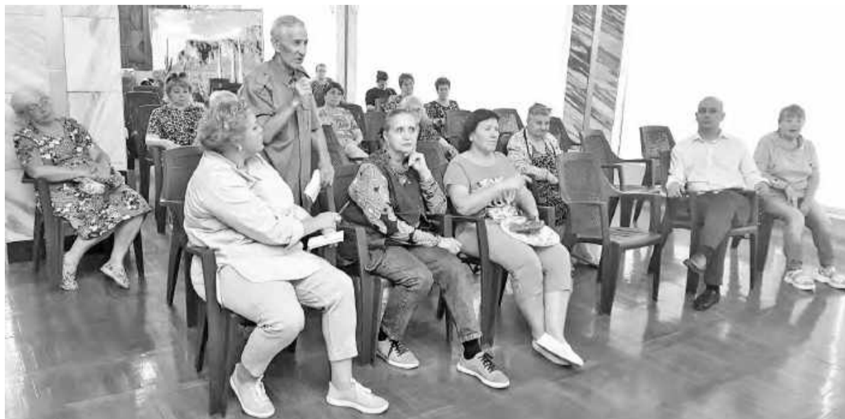
Решаем проблемы всем миром

На встрече был поднят острый вопрос реконструкции очистных сооружений, которые, как известно, давным-давно пребывают в плачевном состоянии. Все необходимые документы по данному крупнейшему проекту в настоящее время находятся в