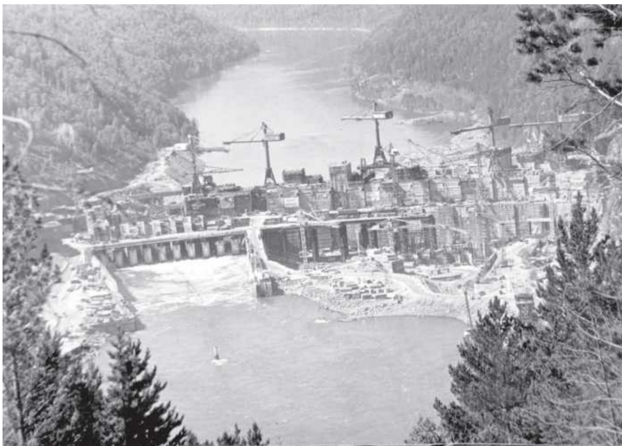
Так набирала высоту Саяно-Шушенская ГЭС

с этими сибирскими разведчиками. Плотину к «рюмочке» «вытаскивали» вместе.