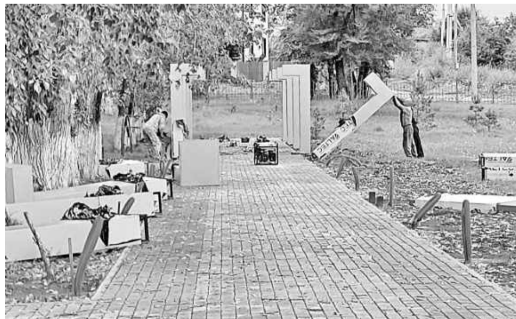
Установка конструкций информационных стендов

В Парке Победы продолжаются работы по обустройству Аллеи памяти.