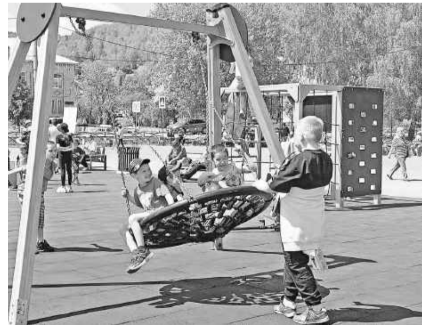
Новый городок - на радость детям

И всё-таки... Основная масса вопросов касалась мусорных завалов на контейнерных площадках. Майнцы изъявили огромное желание перенести некоторые из них в другие места для обеспечения доступности. Здесь, на сходе граждан, они узнали новость о том, что в посёлке скоро начнутся работы по установке ещё трёх современных площадок под сбор ТКО. Что касается уборки стихийных свалок, проблемным местом остаётся площадка на улице Гагарина, которую обещано вычистить в самые ближайшие сроки. Остаётся уповать