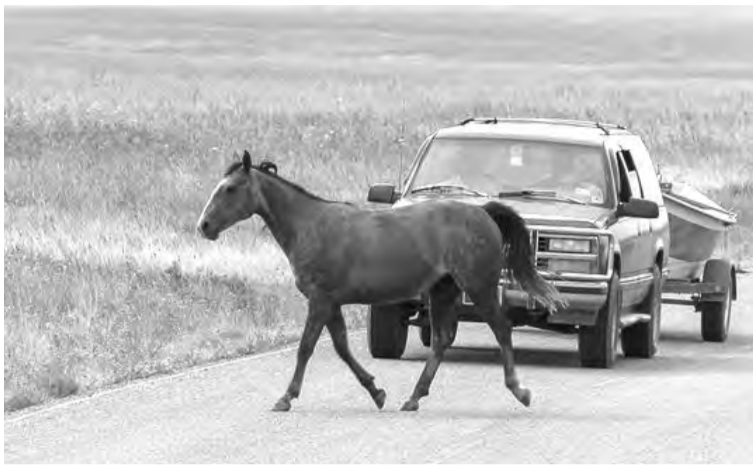
По народному поверью лошадь на дороге - к счастью

Глава муниципального образования город Саяно-