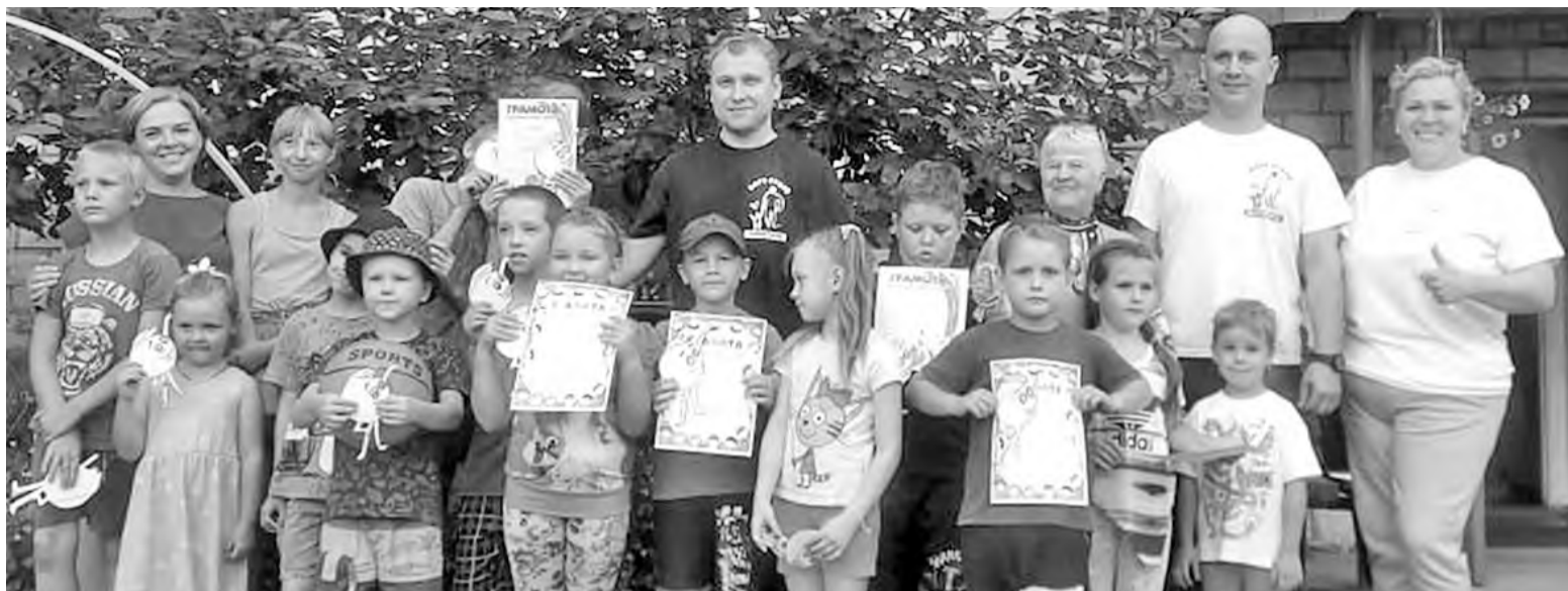
Смех и радость ТОС приносит людям

О том, какой ажиотаж возник вокруг этого мероприятия, говорит тот факт, что на праздник съехалась детвора со всей округи. За ними во двор тосовцев потянулись родители ребят, бабушки и дедушки. Ещё бы! Звучала музыка, в воздухе трепетали связки разноцветных воздушных шаров, а весёлые конкурсы и эстафеты увлекали в свой водоворот всех и каждого. В перерыве между подвижными играми