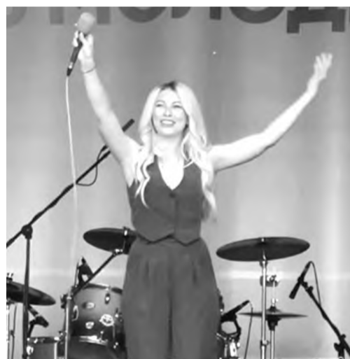
Тянись со мной за мечтой!

Дрейфуя по стадиону от сцены к площадкам, трибунам и обратно, словить эмоции можно было на каждом шагу: вот у прилавков с фенечками и анимашной сувениркой чирикали девчонки; справа клюшками в хоккейной мини-коробке