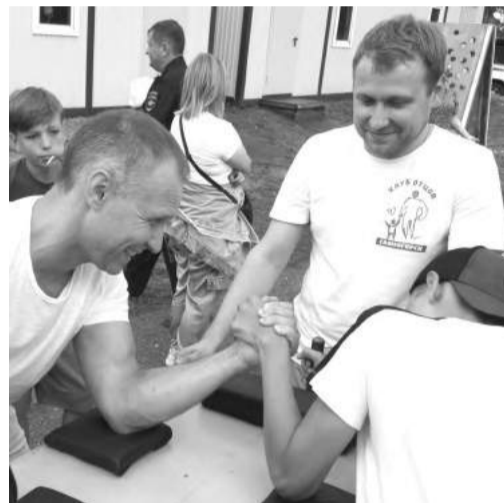
Молодцы - и сыновья, и отцы