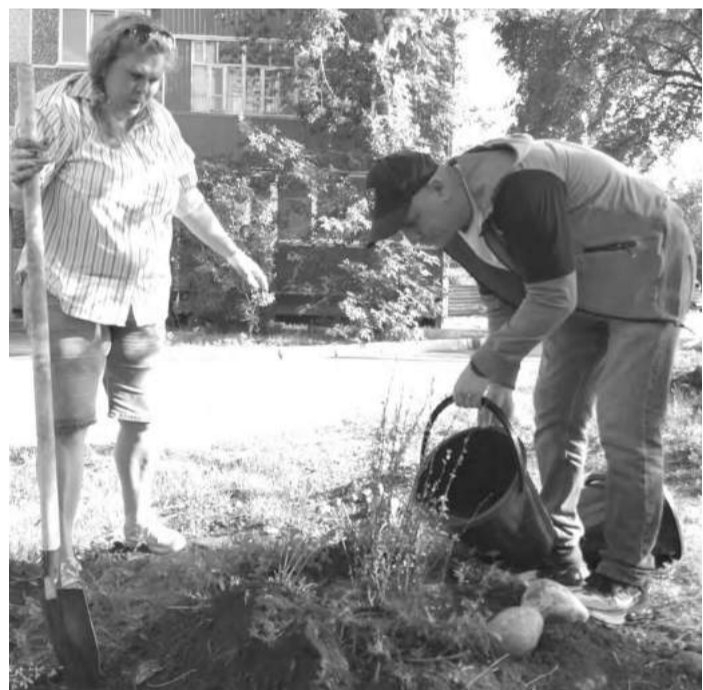
Корни соседской дружбы

лись на качелях, учились делать обережных куколок и играли в подвижные игры. Под финал мероприятия участники спели любимые песни и задорные частушки вместе с весёлыми гостями из самодельного клуба «Мария», которые по-соседски заглянули на вечерок.