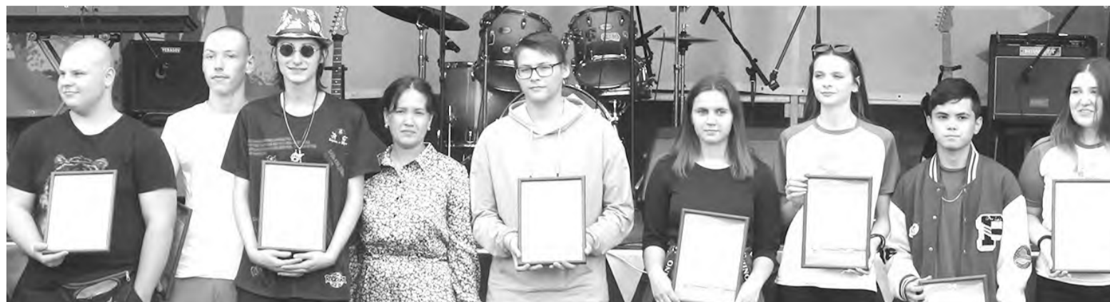
За ними - будущее!