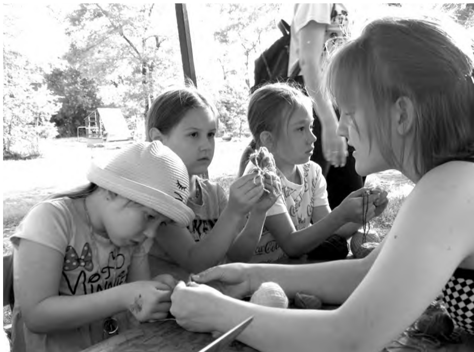
Вместе играть интересней!

Пока взрослые говорили о серьёзном, ребяташки крути-