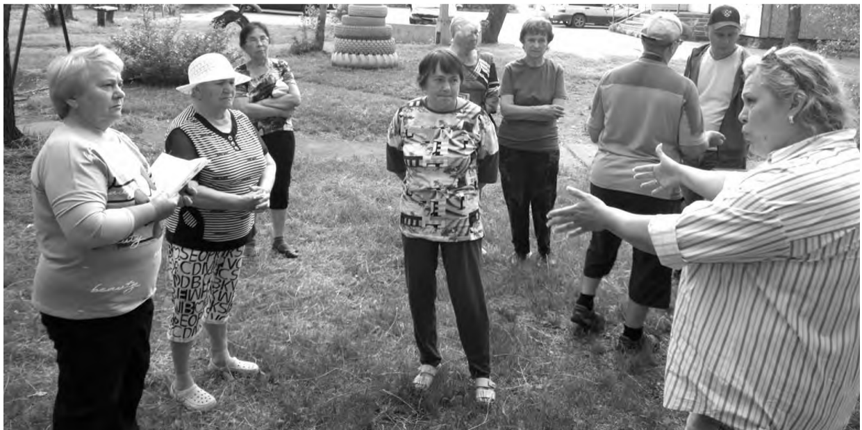
Как улучшить дом, решаем всем двором