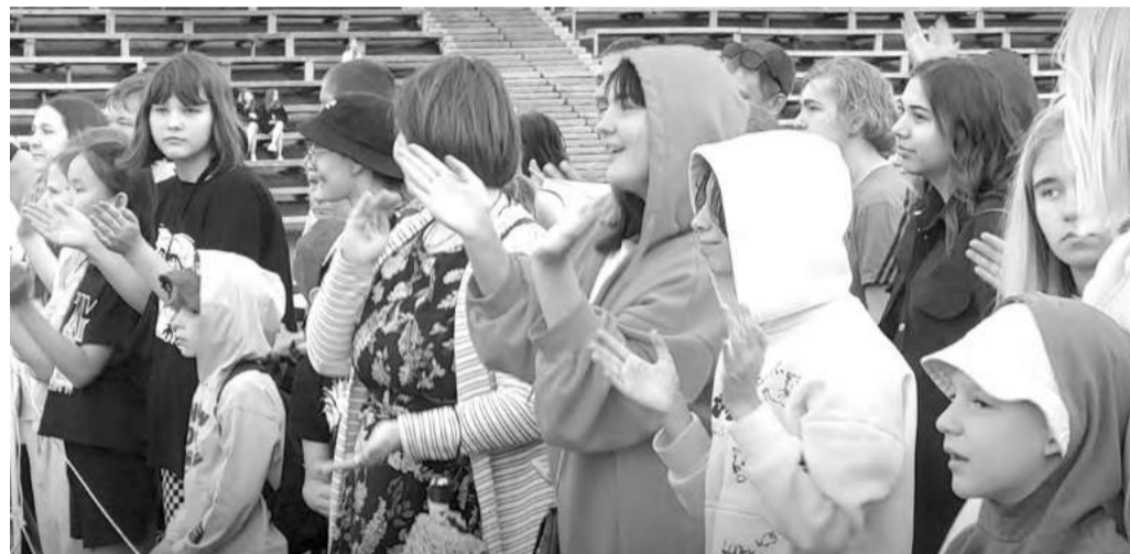
Аплодисменты не смолкали

лов проверили и совсем ещё мальчишки, и подкачавшиеся в спортзале парни. Не удержались от азарта вступить в поединок с младшими соперниками и сами отцы-молодцы, чьи бицепсы могли бы дать фору - однако, поддавшись или нет, в этот раз они уступили победу сыновьям, похвалив, мол, крепкая смена растёт.