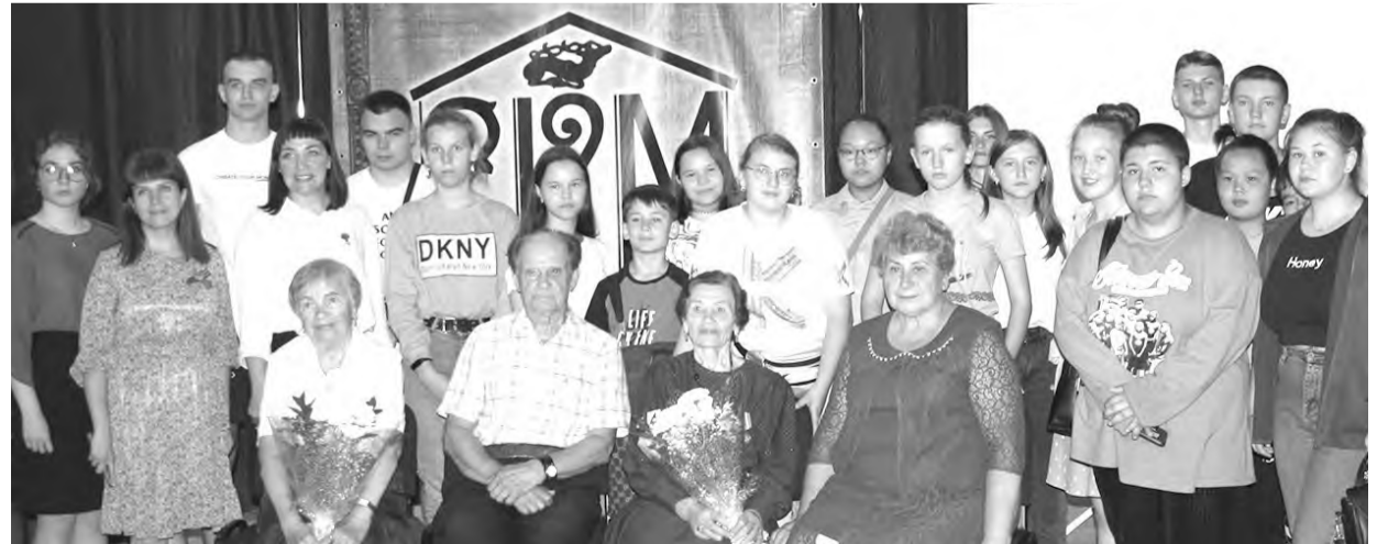
От славных предков к юным поколениям перетекает памяти река