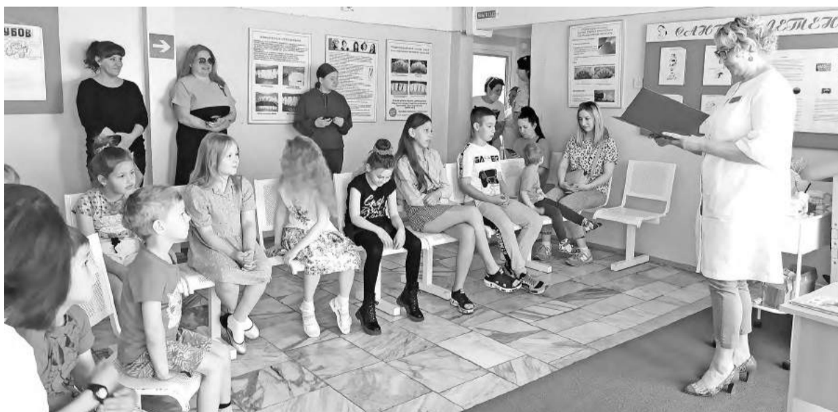
Постигали простые правила ухода за зубами

В День защиты детей большой холл городской стоматологической поликлиники преобразился: на стенах - выставка детских рисунков на тему «Береги зубы смолоду»; на экране телевизора - телесюжеты, где главные герои - зубы, на медицинском столике - муляжи зубов и челюстей, зубные пасты и щётки.