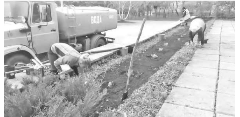
Сегодня - росточки, завтра - цветочки

И с такими резкими погодными «выкрутасами» можно мириться, но при достаточно обильном поливе. Однако, как назло, в очередной раз забарахлила