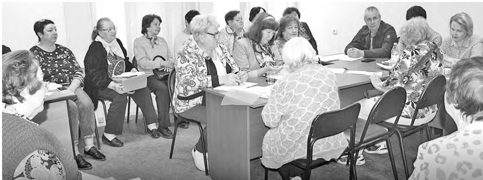
Актив Общественной палаты итожит то, что за полгода прожил

Надо сказать, впечатляет организация дежурства в Общественной палате: с 10.00 (по надобности - с 8.00) до 13.00. В будние дни здесь обязательно находится кто-то из актива, реагирующий на вопросы дня, принимающий горожан, которые приходят сюда за получением той или иной информации. Большая роль отводится регулярно проводимым заседаниям совета Общественной палаты с приглашением представителей Администрации города, депутатов Совета депутатов муниципалитета, компании РУСАЛ, правоохранительных органов,