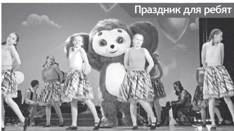
Праздник для ребят