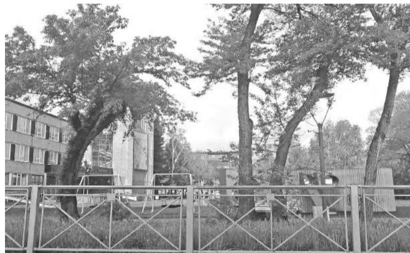
Такая «причёска» вязам к лицу

всё, на что хватает сегодня наших сил и средств. А если не прочистить зелёный массив своевременно, погибают не только ветви деревьев, но и стволы.