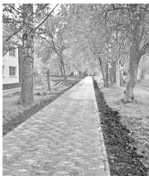
Новый наряд пешеходной дорожки

- Подрядчик произвёл работы по отсыпке и планировке будущего сквера, - сообщает народный избранник. - Продолжаю следить за ходом работ. Впечатляет строительство пешеходной дорожки, пролегающей от дома № 57 по улице Гагарина (район магазина «Гагаринский») до дома № 52 по улице Ленина. Дорожка уже выложена брусчаткой, смотрится красиво, угадывается хорошее качество укладки, что предстоит проверить специалистам. Вдоль дорожки установлены четыре современные лавочки и столько же урн, выполнены работы по освещению. Манёвренный бобкэт разравнивает