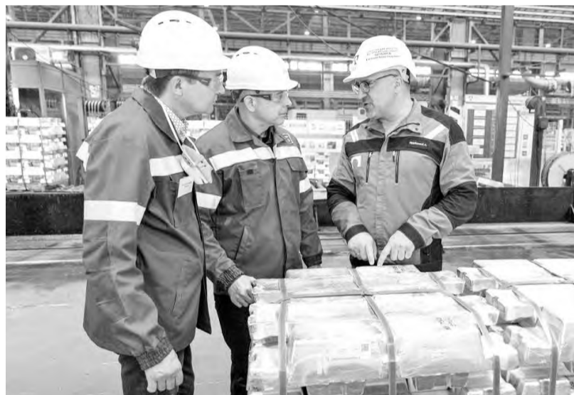
Завод - сердце города

- Многих интересует, будет ли работать роддом, расположенный в посёлке Майна. Это было странно слышать, потому что на мой депутатский запрос, отправленный осенью прошлого