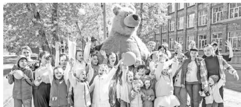
Весёлый медведь увлёт свои задором

Детство - удивительная пора, когда огромный и прекрасный мир полон ярких красок, когда впереди - множество дорог и все мечты кажутся исполнимыми.