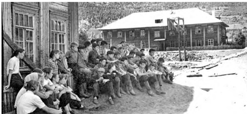
На заднем плане первая Майнская начальная школа

которая к нашему приходу наكدывала полные топки дров, и мы с мороза, входя в школу, обнимали тёплые бока контрамарки и грелись. В конце коридора стоял большой стол, заставленный стаканами с бесплатным молоком. Пей, сколько хочешь.