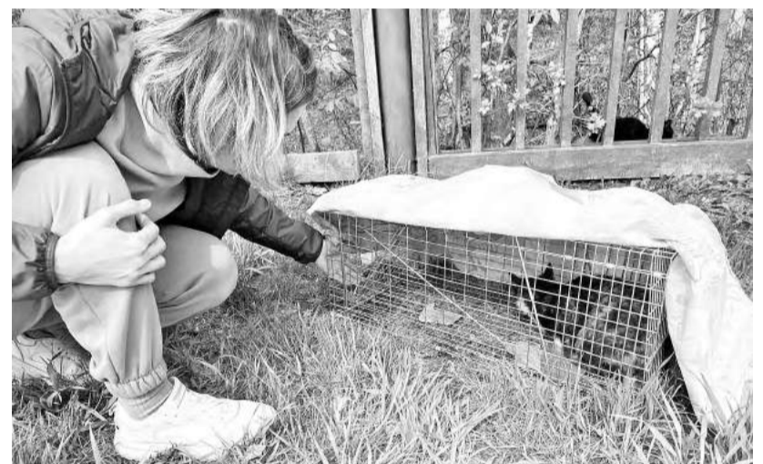
На отлове бездомной кошки Анастасия Финашкина

Активные волонтеры объединяют вокруг себя людей, которые не состоят в группах. Например, сердобольные бабушки, которые кормят кошек, контактируют с волонтерами и рассказывают о каких-то проблемах: новая кошечка появилась, котик заболел, котятка родилась.