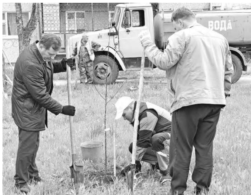
Здесь зацветёт аллея

- Хорошая и нужная акция, - отметил Глава города. - Уважаемые саяногорцы, присоединяйтесь! Включайтесь в посадку саженцев вместе со своими управляющими компаниями и в дальнейшем ухаживайте за деревцами и кустарниками, чтобы они радовали всех нас пышной зеленью, цветением и плодами.