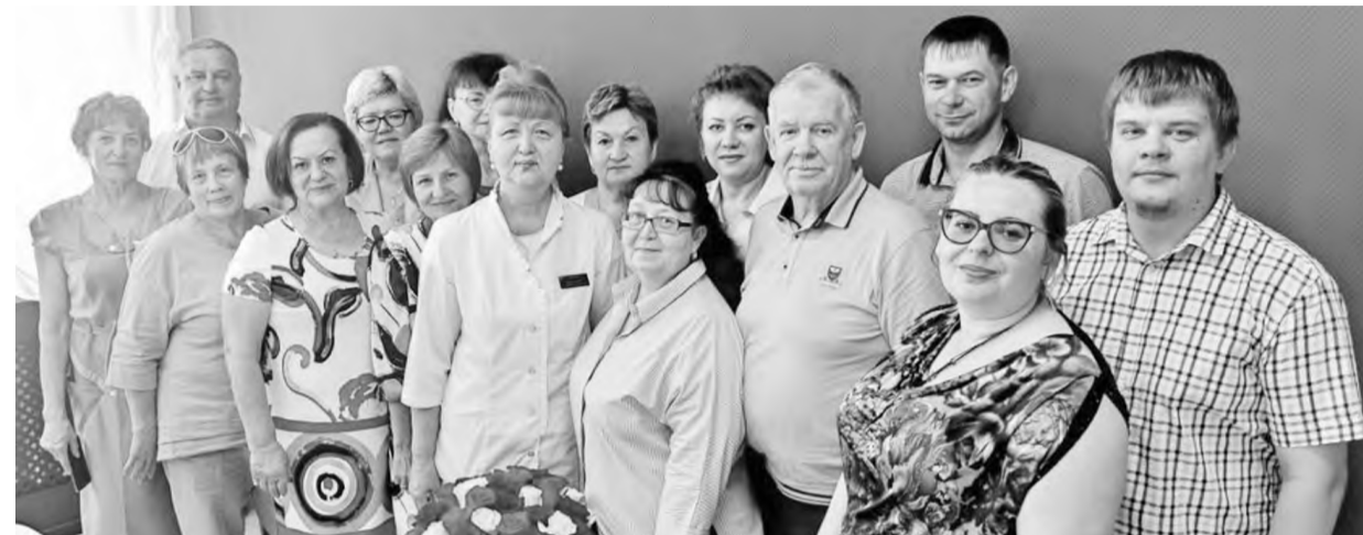
Такой сплочённый, дружный коллектив