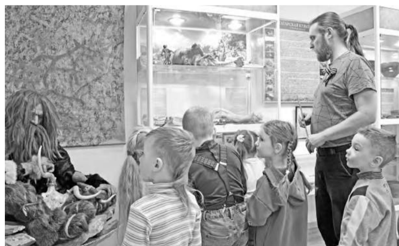
Познавательная экскурсия для малышей

вых конкурсах компании РУСАЛ и успешно реализуем победные проекты. В этом большую помощь оказывает Центр социальных программ РУСАЛА. Победителями грантовых конкурсов стали проекты, направленные на изучение древней истории нашего края, - «Археолог и Я», «Ключ знаний в древний мир».