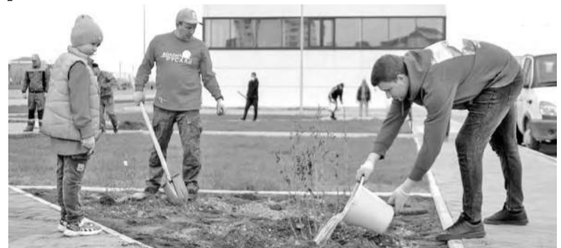
При посадке полив - вещь необходимая

Чтобы зелёным питомцам прижиться, заранее подготови-