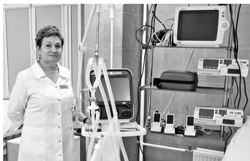
Главная медицинская сестра - в отделении анестезиологии и реанимации

- Представляете, я не могла дожидаться окончания отпуска, чтобы как можно скорее вернуться в родной коллектив! - не скрывает эмоций моя собеседница. - К работе все относилось очень ответственно, несмотря на