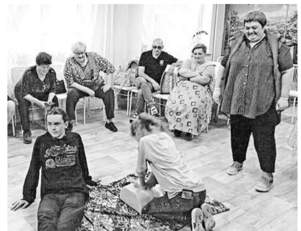
Первую помощь оказать сумеем