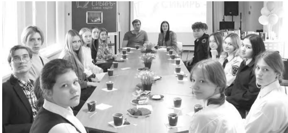
За творческим чаем не скучаем!