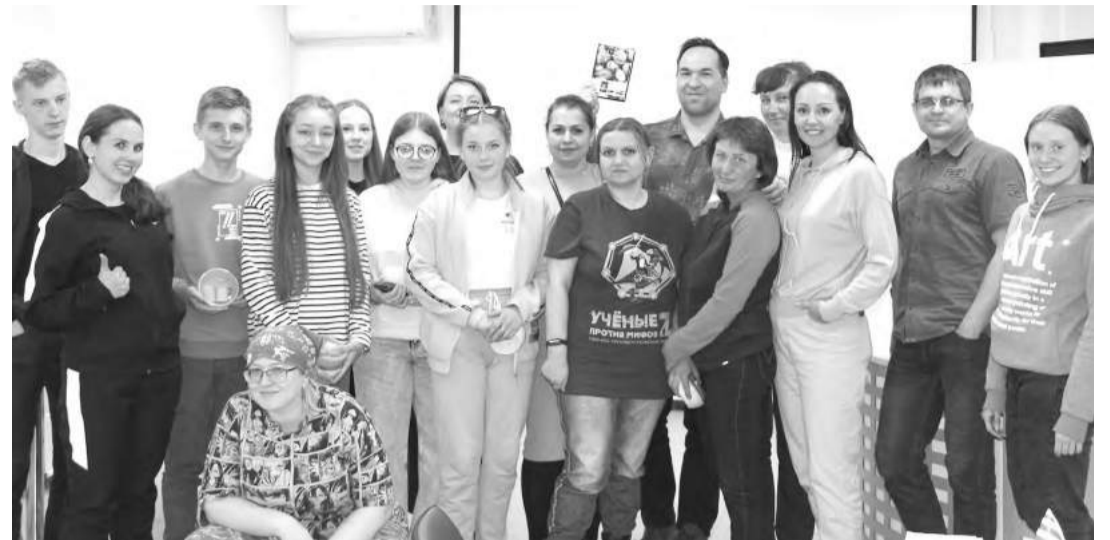
Туристы и мыслители к дороге в жизнь готовы

В рамках проекта «Гений места» в Центральной библиотеке впервые прошла интерактивная «Школа критического мышления» для туристов.