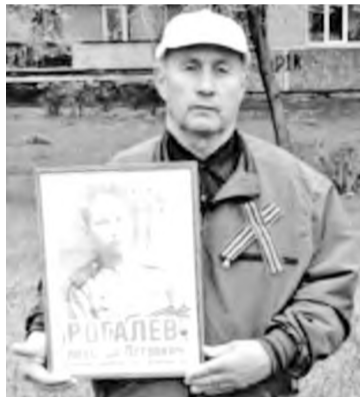
С портретом отца

при этом доблесть и мужество награждён медалью «За отвагу», орденом Красной Звезды