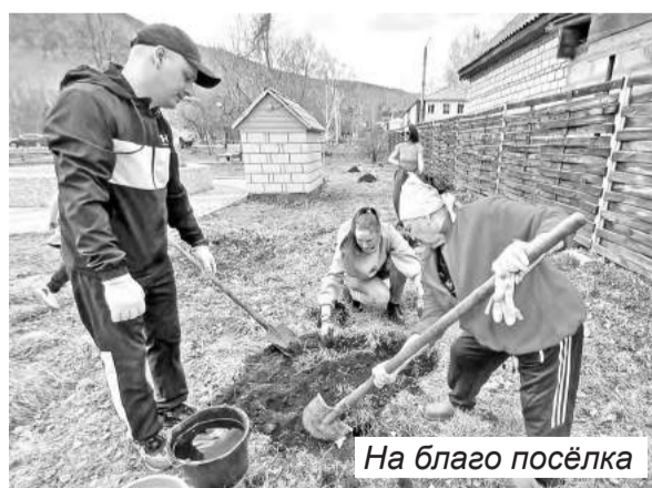
На благо посёлка

Последняя суббота апреля выдалась очень тёплой. Задолго до назначенного времени в сквер «Яблоко» посёлка Майна стали подтягиваться добровольцы, неравнодушные к своей малой родине. Именно в этот день актив ТОС «Зона отдыха» при поддержке поселковой администрации запланировал акцию по высадке саженцев в липовую аллею.