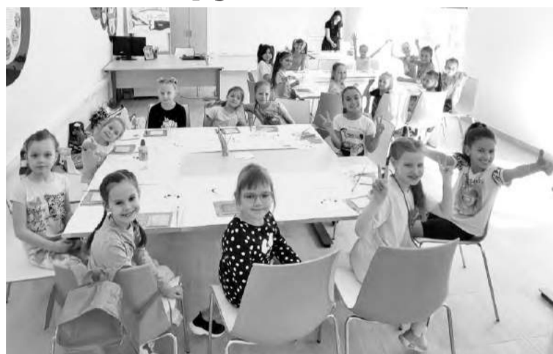
Тренинг по рисованию

Гидроэнергетики научили также воспитанников школ основам оказания первой помощи, объяснили, как правильно вести себя в экстремальных ситуациях, в том числе, что делать, если увидели оборванный провод, и познакомили со средствами индивидуальной защиты, применяемыми на производстве.