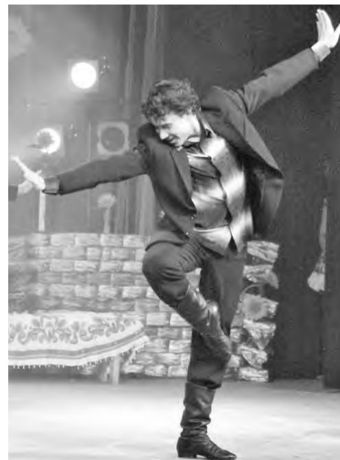
Мастер держать ритм и баланс