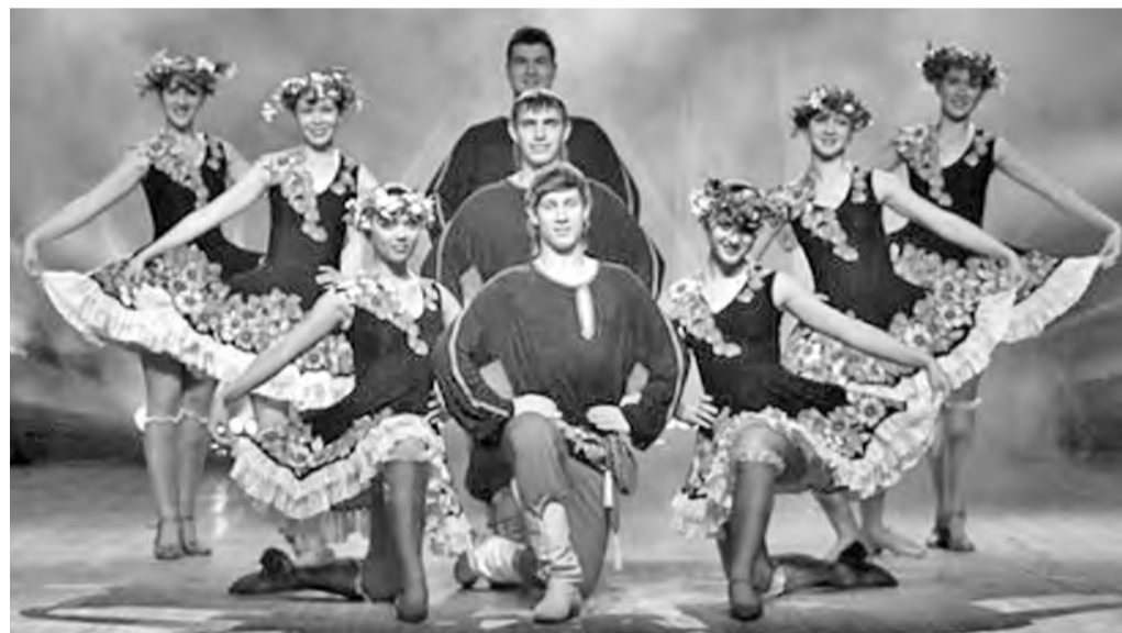
Артист, руководитель и солист с коллегами из «ТанцПарада»